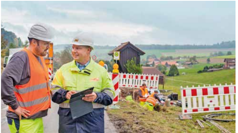
Qualitätssicherungsbeauftragter der e-netz Süd Hessen bei der Kontrolle der Sicherheitsbestimmungen

werden. Ein schadhaftes Mittelspannungskabel kann dadurch kurzzeitig stillgelegt und die Versorgung einfach über „Umleitungen“ auf andere Kabel sichergestellt werden. Solche Störungen dauern oft nur wenige Minuten, meist betreffen sie allerdings viele Kunden und lösen eine Anruflawine aus. In der Querverbundleitstelle zehrt das an den Nerven der Schaltmeister, die zeitgleich mit der Lokalisierung und Behebung des Schadens beschäftigt sind. Zur Abhilfe hat die e-netz Süd Hessen das Informationssystem „e-netz-Ticker“ entwickelt, damit Kunden über Webseiten und per App über Stromstörungen informiert werden und Hilfe erhalten. Versorgungsstörungen im Niederspannungsnetz, über das die Mehrheit der Endverbraucher versorgt werden, werden nicht automatisch erfasst. Kunden melden dann die Unterbrechungen über die bekannten Störungsnummern. Konkret formulierte Fragen der Servicekräfte an die Anrufer ermöglichen schnelle Hilfe und klären, ob die Störung im öffentlichen Stromnetz liegt oder ein Defekt in der Hausinstallation besteht. Die Netzkunden sind bei Störungen aus der Routine gerissen. Was als selbstverständlich angesehen wird, funktioniert plötzlich nicht mehr. Der Unmut über den Stromausfall wird leider oft dem Kundendienst persönlich angelastet. Es spielen sich dann kleine und gar große Tragödien ab. Am Störungstelefon und auch beim Bereitschaftseinsatz ist von aufgebrachtten Kunden einiges zu hören: Von „die Liveübertragung ist ausgefallen“ über