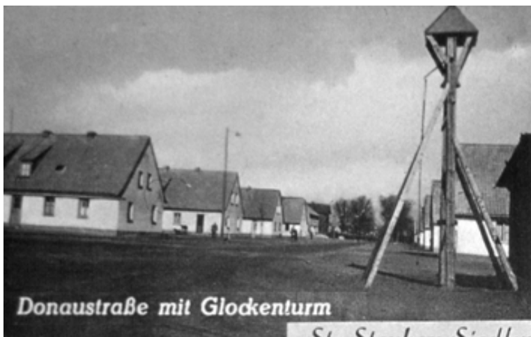
Donaustraße mit Glockenturm