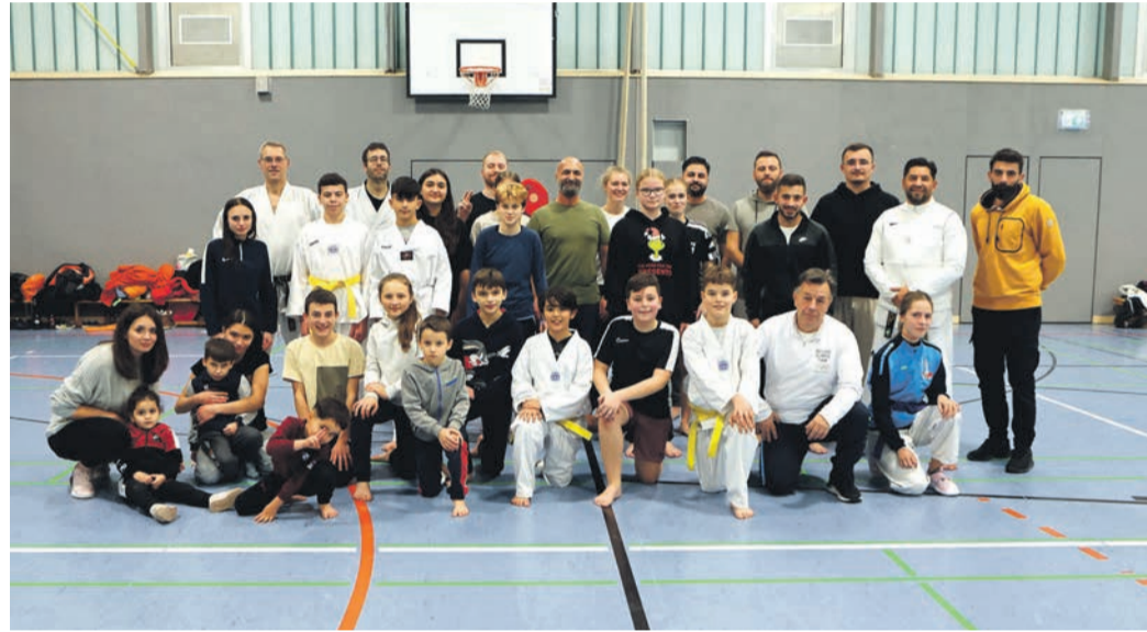
Seit gut einem Monat trainieren die Waisenkinder aus der Ukraine gemeinsam mit den anderen Mitgliedern des GKV Lotus Eppertshausen/Rödermark.