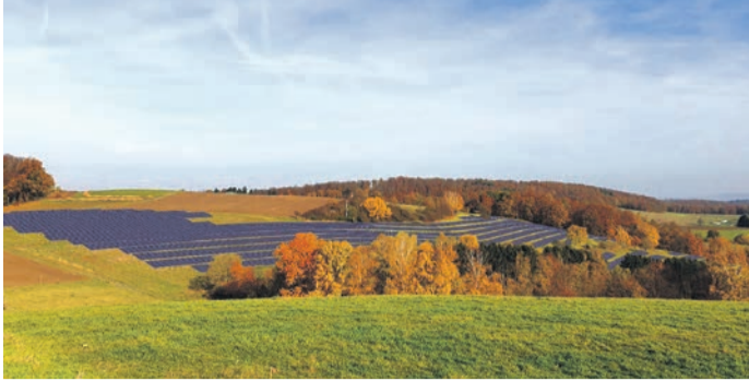
Der in Planung befindliche Bürgersolarpark Klein Bieberau (Gemeinde Modautal), ein gemeinsames Projekt von ENTEGA und Energiegenossenschaft Odenwald, er soll voraussichtlich Ende 2024 in Betrieb gehen.