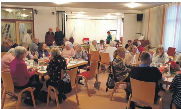
Ein paar schöne Stunden mit Kaffee, Kuchen und Musik verbrachten die Senioren in den Räumen des ev. Gemeindehauses.

Während derzeit Vieles mit Blick auf die Zukunft des Vereins Seniorenhilfe Eppertshausen noch ungewiss scheint, konnte man an diesem Nachmittag erleben, wie wichtig verlässliche Orte des Miteinanders sind. Die Organisatoren haben wieder all ihr Können als Team ehrenamtlich eingebracht und damit für alle Besucher diese dunkle und ungemütliche Novemberzeit heller und wärmer werden lassen. Das stimmt zuversichtlich: Es braucht schon einiges an Vorbereitung und Planung, um ein solches Fest auszurichten und der schönsten Dank ist, wenn das Angebot so gut angenommen wird. Die Seniorenhilfe Eppertshausen kann zwar auf einen reichen Erfahrungsschatz zurück-