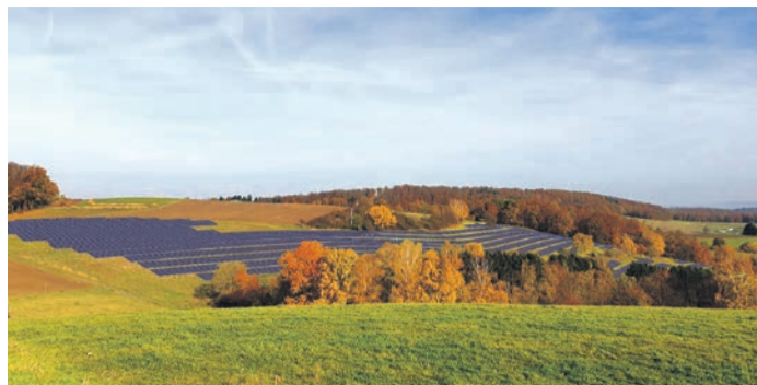
Der in Planung befindliche Bürgersolarpark Klein Bieberau (Gemeinde Modautal), ein gemeinsames Projekt von ENTEGA und Energiegenossenschaft Odenwald, er soll voraussichtlich Ende 2024 in Betrieb gehen.