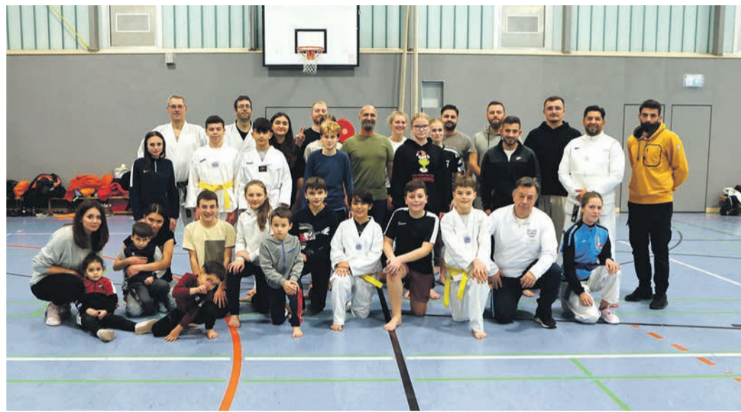
Seit gut einem Monat trainieren die Waisenkinder aus der Ukraine gemeinsam mit den anderen Mitgliedern des GKV Lotus Eppertshausen/Rödermark.