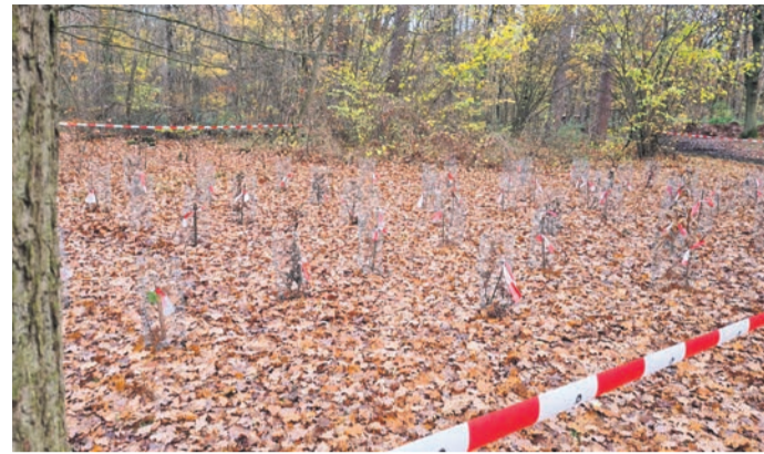
Damit sie auch gut anwachsen, sind die jungen Bäumchen noch geschützt.

Obertshausen (NZO) Nachwuchs für den Waldpark: Dieser Tage haben Fachleute insgesamt 90 Baumsetzlinge im Spielplatzbereich des Areals an der Tempelhofer Straße eingepflanzt. Die Aufforstungsmaßnahme wurde seitens des städtischen Fachdienstes Landschaft und Spielraum mit Experten von Hessen Forst und der Unteren Naturschutzbehörde des Kreises Offenbach abgestimmt.