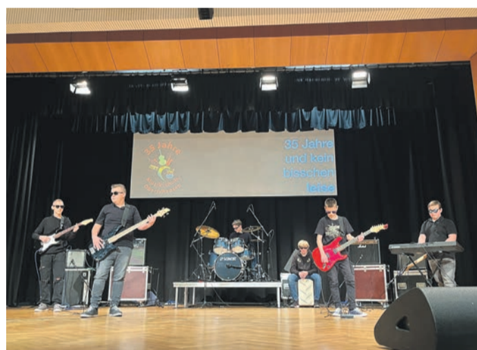
Musik begeistert und Musik machen umso mehr. Das Programm zu „35 Jahre Musikschule Obertshausen“ zeigte die Vielfalt der Einrichtung auf.

Am 1. Januar 2018 übernahm die Stadt Obertshausen neben dem Volkshochschulangebot auch den Geschäftsbereich Musikschule des damaligen Volksbildungswerkes. Die Musikschule gehört seitdem zum städtischen Fachbereich Sport,