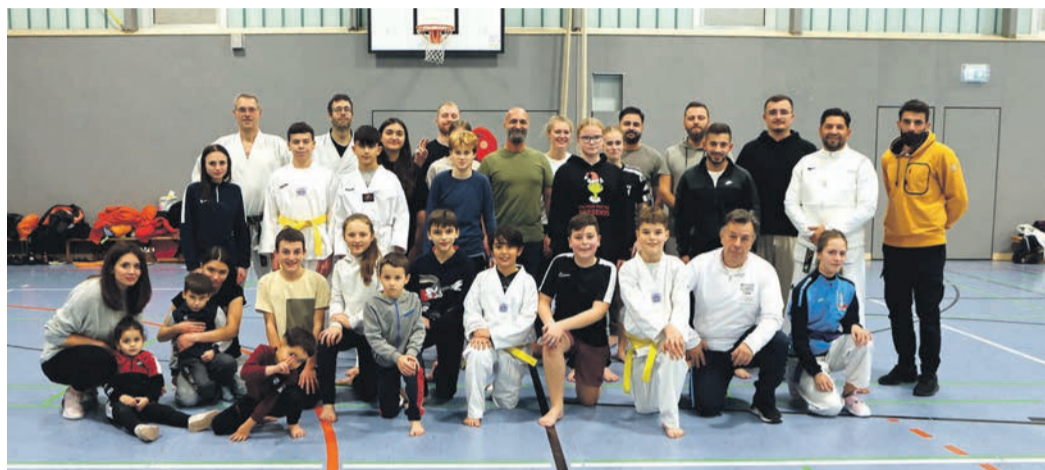
Seit gut einem Monat trainieren die Waisenkinder aus der Ukraine gemeinsam mit den anderen Mitgliedern des GKV Lotus Eppertshausen/Rödermark.