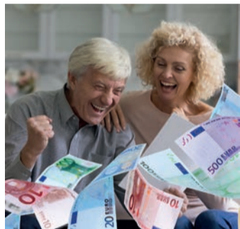
Es geht um viel Geld.

Bei einem Widerruf erhalten Sie – anders als bei der Kündigung – alle eingezahlten Beiträge ohne Abzug von Maklerprovisionen und Verwaltungskosten zurück. Und nicht nur das: Die Versicherung muss Sie auch an dem mit Ihrem Geld erzielten Anlageertrag beteiligen. So können Sie sich bis zu 150 % der eingezahlten Beiträge zurückholen. Ein sattes Plus auf Ihrem Konto winkt!