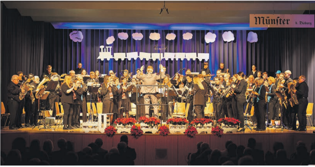
Jugendorchester, Horsch e-mol(l) und Großes Orchester bei der gemeinsamen Zugabe.