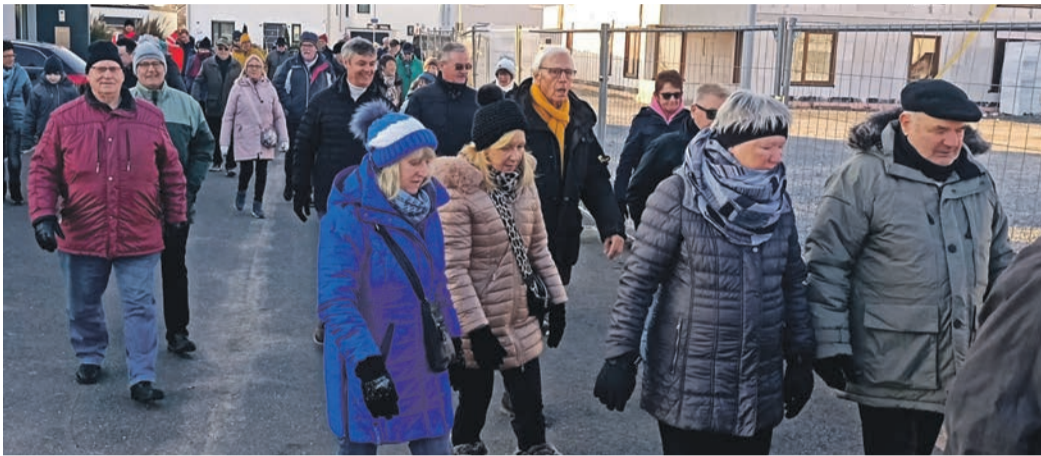
Die Eppertshäuser Grenzgänger umfassten dieses Jahr rund 60 bis 70 Personen.

Der Grenzgang ging über sieben bis acht Kilometer und stieß an die Gemarkungsausläufer von Rödermark, Rodgau und Babenhausen. Der Abschluss fand wie immer in der Bürgerhalle statt, wo das DRK für die Abwehrkräfte einen Gemüseintopf reichte. Die Teilnehmerzahl bewegte sich wie in den letzten Jahren zwischen 60 und 70 Personen. „1988 erlebte der Grenzgang mit 500 Personen den größten Zuspruch. Mit der geplanten Mülldeponie zwischen Ober-Roden und Eppertshausen bewegte die Menschen damals ein heiß diskutiertes Vorhaben“, weiß