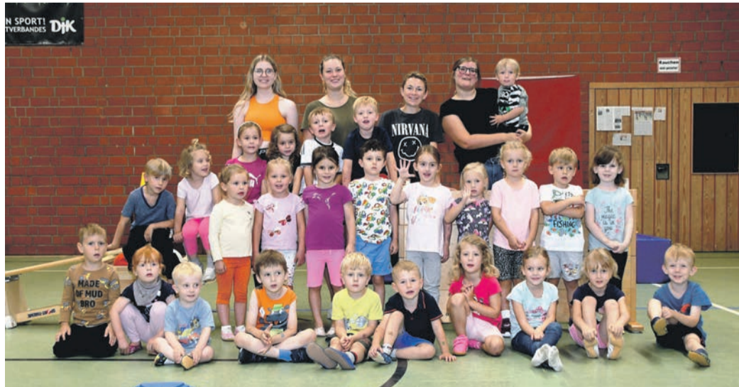
Die Gymnastik-Abteilung der DJK Blau-Weiß Münster boomt und treibt das Wachstum des Gesamtvereins. Das Foto zeigt Übungsleiterinnen und Kinder der beiden „Turn-Äffchen“-Gruppen - zwei von 13 in der mittlerweile größten DJK-Abteilung.