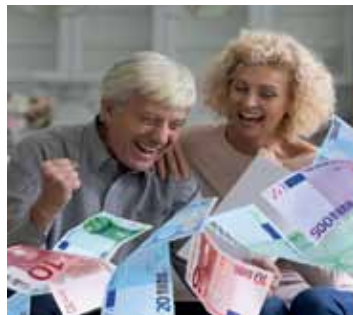
Es geht um viel Geld.

Bei einem Widerruf erhalten Sie – anders als bei der Kündigung – alle eingezahlten Beiträge ohne Abzug von Maklerprovisionen und Verwaltungskosten zurück. Und nicht nur das: Die Versicherung muss Sie auch an dem mit Ihrem Geld erzielten Anlagegewinn beteiligen. So können Sie sich bis zu 150 % der eingezahlten Beiträge zurückholen. Ein sattes Plus auf Ihrem Konto winkt!