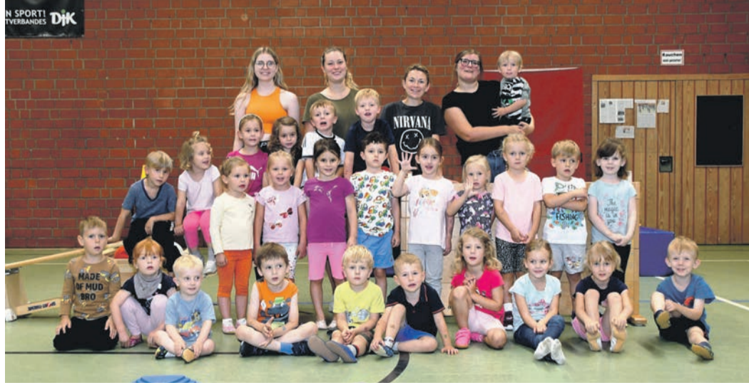
Die Gymnastik-Abteilung der DJK Blau-Weiß Münster boomt und treibt das Wachstum des Gesamtvereins. Das Foto zeigt Übungsleiterinnen und Kinder der beiden „Turn-Äffchen“-Gruppen - zwei von 13 in der mittlerweile größten DJK-Abteilung.