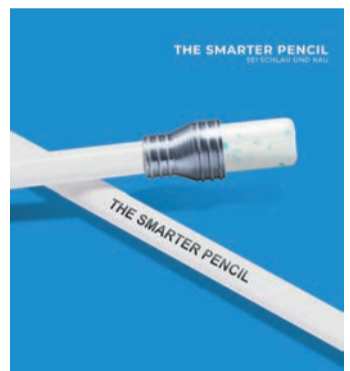
* Mars Wrigley, Work & Study Survey 2023. Repräsentative Online-Befragung mit 1.000 Personen zwischen 16 und 65 Jahren, durchgeführt von Appinio im Auftrag von Mars Wrigley Deutschland.

Eine neue Antwort auf die Konzentrations-Bedürfnisse der Deutschen ist The Smarter Pencil .