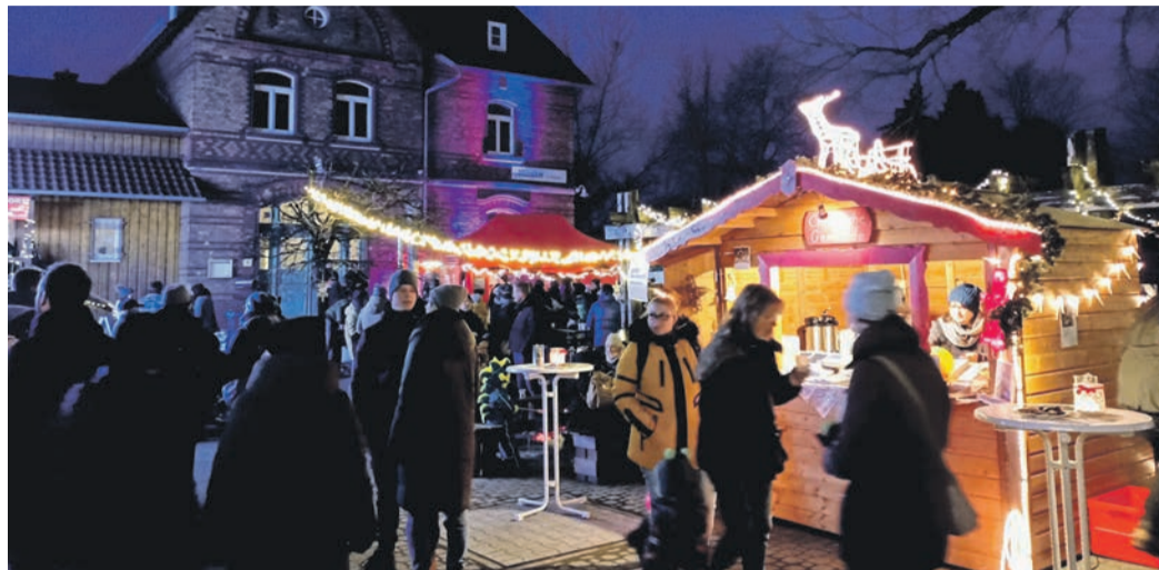
Der Münsterer Weihnachtsmarkt streut am Bahnhof deutlich mehr Romantik aus als am alten Standort vor dem Rathaus.

Der Entschluss wurde mit einem breiten Bravo honoriert, denn in den letzten Jahren kam die Veranstaltung fast nur durch das Engagement kleiner Gruppen wie den Messdienern, der Christlichen Gemeinde oder diverser Stammtische zustande. Sorgen die „Schoßbepetzer“ mit ihren Bratwürsten 2022 für das einzige