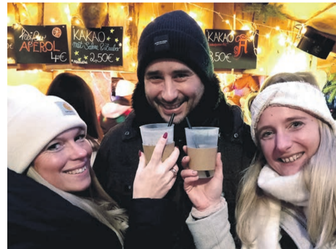
Einige Besucher wurden auf dem Weihnachtsmarkt regelrecht verwöhnt.

Zum Markt gehörte freilich der Besuch des Nikolaus, der sich am Sonntagnachmittag