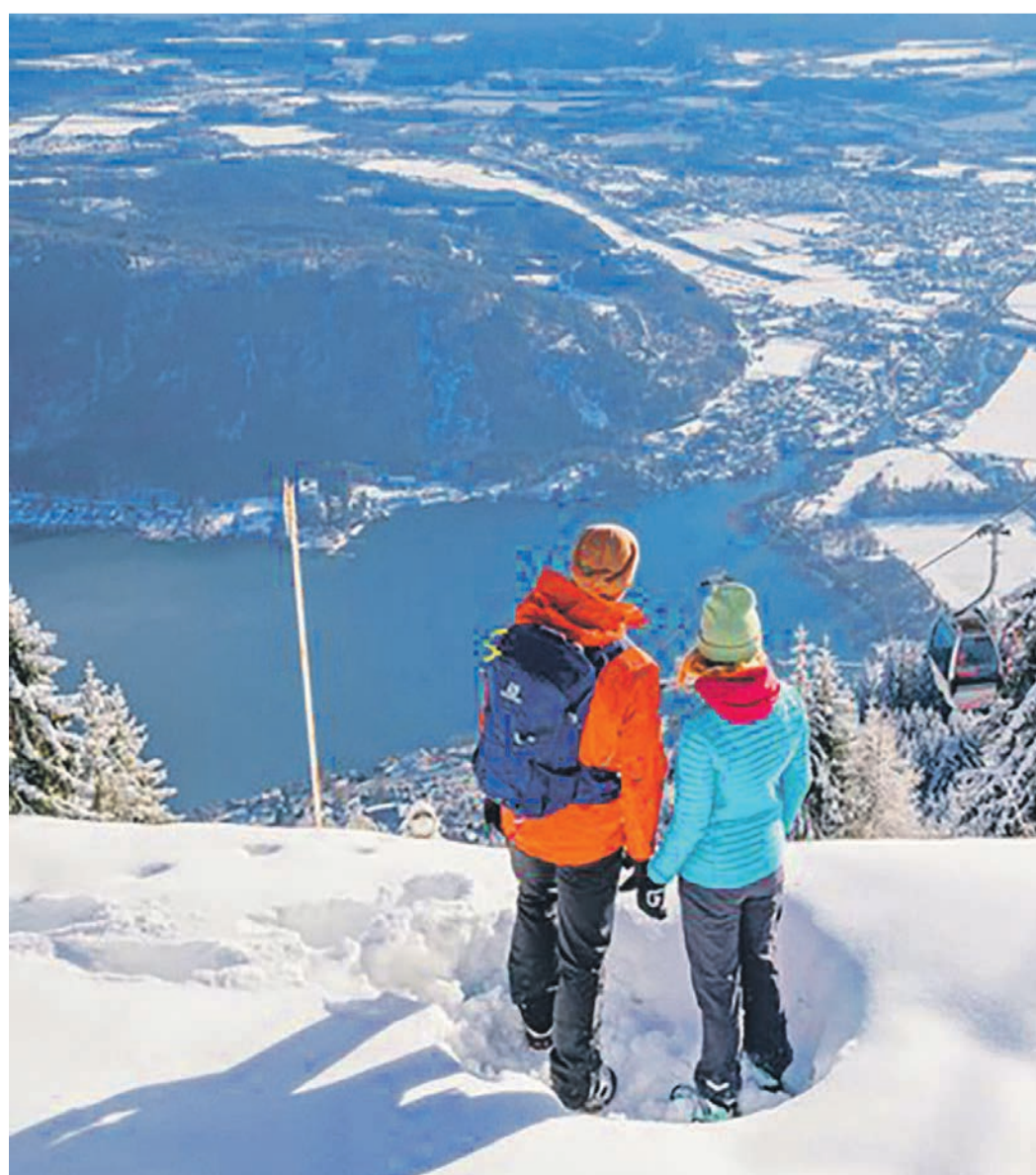
Die Gerlitzen Alpe bietet Wintersport und weite Panoramablicke.