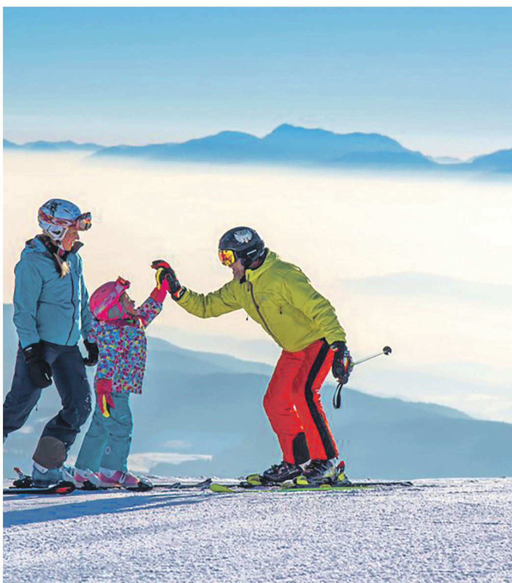
Das Kärntner Skigebiet Gerlitzen Alpe in der Nähe von Villach und dem Ossiacher See ist ein beliebtes Wintersportziel für Klein und Groß.

Das gilt natürlich auch für entspannte und erlebnisreiche Ausflüge zum See, in die Therme und in die Stadt.