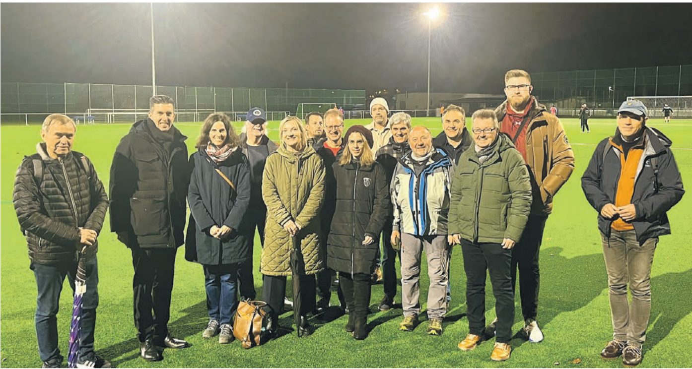
Magistrats- und Ausschussmitglieder sind auf Recherche rund um das Thema Kunstrasenplatz. Im Zuge dessen stand jüngst auch eine Besichtigung des Kunstrasenplatzes in Offenbach-Tempelsee an.