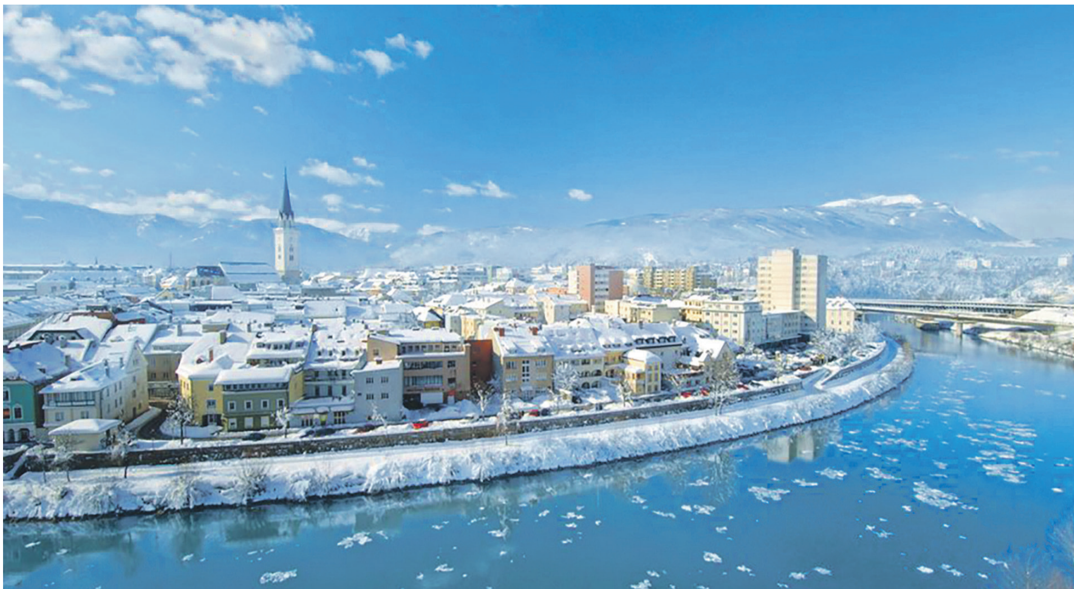
Villach lockt im Winter mit Adventmarkt, Eislaufplatz und dem „Winter Wunder Wald“.