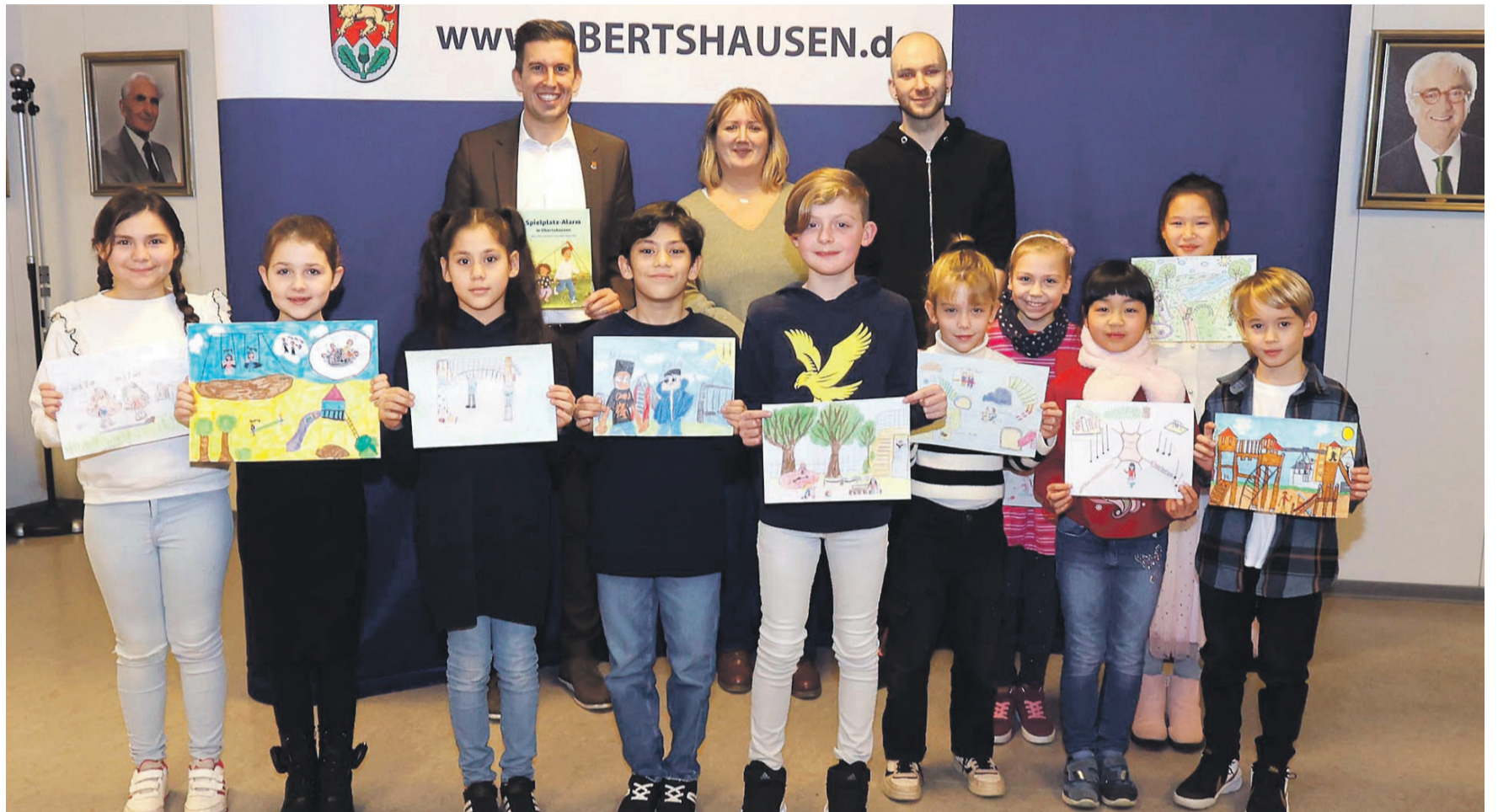
Die Maler und Malerinnen der zehn schönsten Bilder wurden im Rathaus geehrt.