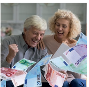
Es geht um viel Geld.

Bei einem Widerruf erhalten Sie – anders als bei der Kündigung – alle eingezahlten Beiträge ohne Abzug von Maklerprovisionen und Verwaltungskosten zurück. Und nicht nur das: Die Versicherung muss Sie auch an dem mit Ihrem Geld erzielten Anlagegewinn beteiligen. So können Sie sich bis zu 150 % der eingezahlten Beiträge zurückholen. Ein sattes Plus auf Ihrem Konto winkt!