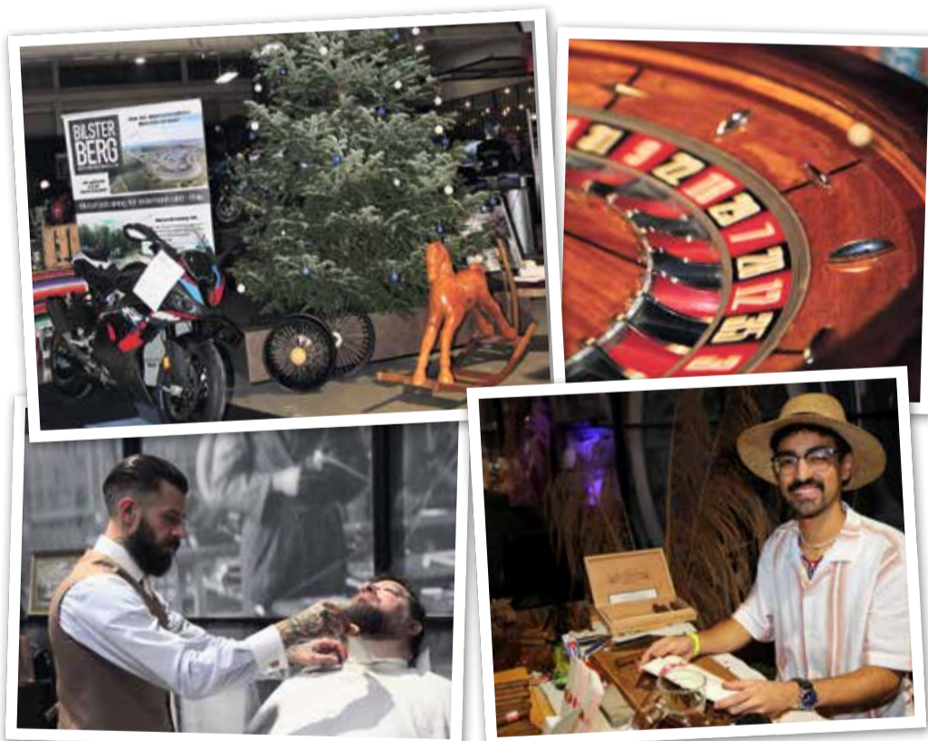
Impressionen aus der kultigen Fabrikhalle in Fechenheim.