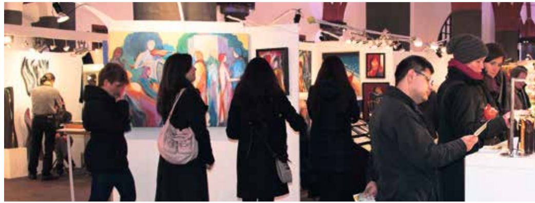
Kunsterinteressierte betrachten die Werke in den Römerhallen.

Künstler-Weihnachtsmarkt bietet im Römer viel Neues, aber auch Bewährtes