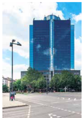
Das City Gate

Das markante City Gate Bürohaus, einst das höchste Gebäude Frankfurts bis 1972, hat seine