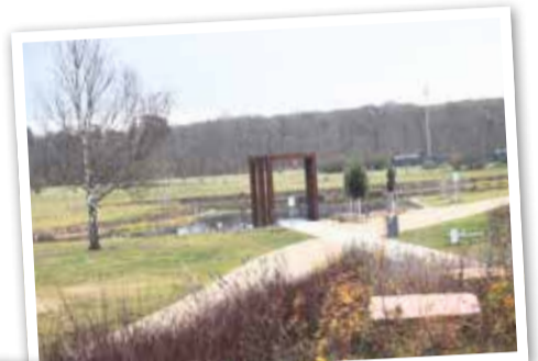
Der Rennbahnpark.

Sandgrasnelke ein entscheidendes Element. Die Gestaltung verbindet nun auf besondere Weise die Aspekte Ökologie und Freizeitnutzung. Die Würdigung des Rennbahnparks sowie die der Ruhrorter Werft unterstreicht die Bedeutung dieser umfangreichen Neugestaltungen für die Stadt. Durch die Schaffung attraktiver und öffentlich zugänglicher Grünräume wird das städtische Leben bereichert und die Lebensqualität der Bürgerinnen und Bürger nachhaltig verbessert.