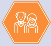
Betriebliche Altersvorsorge ZVK*

Als moderner Arbeitgeber bieten wir flexible Arbeitszeiten, Weiterbildungsmaßnahmen, unbefristete Arbeitsverträge und viele andere Benefits.