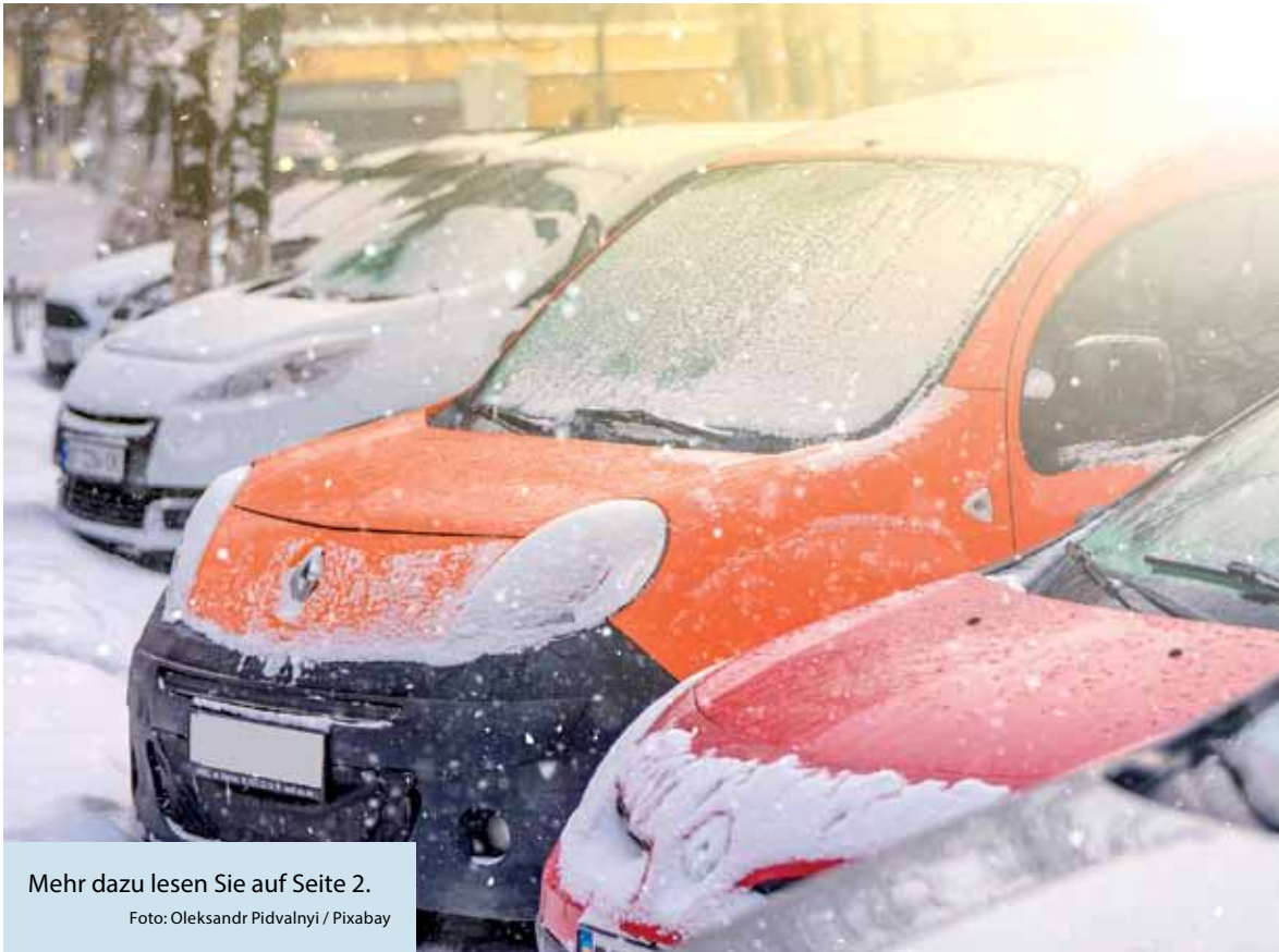
Mehr dazu lesen Sie auf Seite 2.