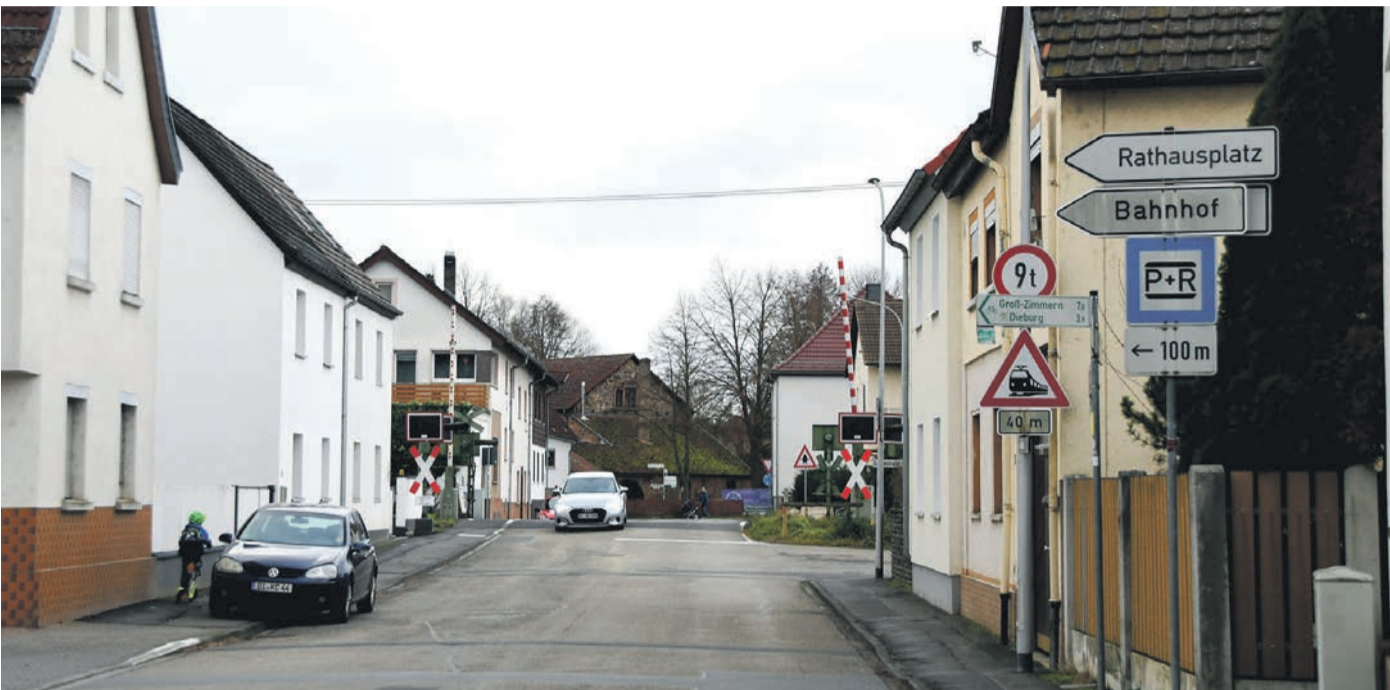
Die Investitionen der Gemeinde Münster bleiben 2024 überschaubar. Die ersten 600.000 Euro von Gesamtkosten in Höhe einer Million sollen dann in die Kanalerneuerung in der Bahnhofstraße (Foto, hinten der Bahnübergang) fließen.

Gemeindevertretung: Bürgermeister bringt defizitären Haushalt ein / Lichtblicke bei Gewerbe- und Einkommensteuer