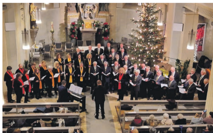
Finale des Weihnachtskonzerts. Con anima vom Frauenchor Frohsinn Ober-Roden und die Sänger der Germania Eppertshausen beim gemeinsamen Abschlusslied.