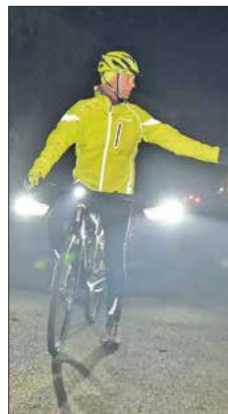
Reflektoren an der Kleidung sind in der dunklen Jahreszeit angesagt.

Wer mit dem Rad zur Arbeit oder in die Schule fährt, sollte regelmäßig die Beleuchtung am Fahrrad überprüfen. Gesetzlich vorgeschrieben sind Vorder- und Rückleuchten sowie Front- und Rückreflektoren. Viele moderne Licht- und Dynamosysteme haben eine zusätzliche Standlichtfunktion integriert, die ebenfalls die Sicherheit im Dunkeln erhöht. Fahrräder und