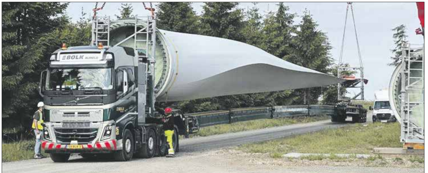
Anlieferung eines Rotorblatts mit Spezial-Lkw am ENTEGA-Windpark Binselberg bei Groß-Umstadt.

Mit der erfolgreicher Flächenakquisition beginnt die eigentliche Projektentwicklung, um den jeweiligen Wind- oder Solarpark nach zwei bis fünf Jahren errichten zu können. Die Projektentwicklung beinhaltet alle notwendigen Tätig-