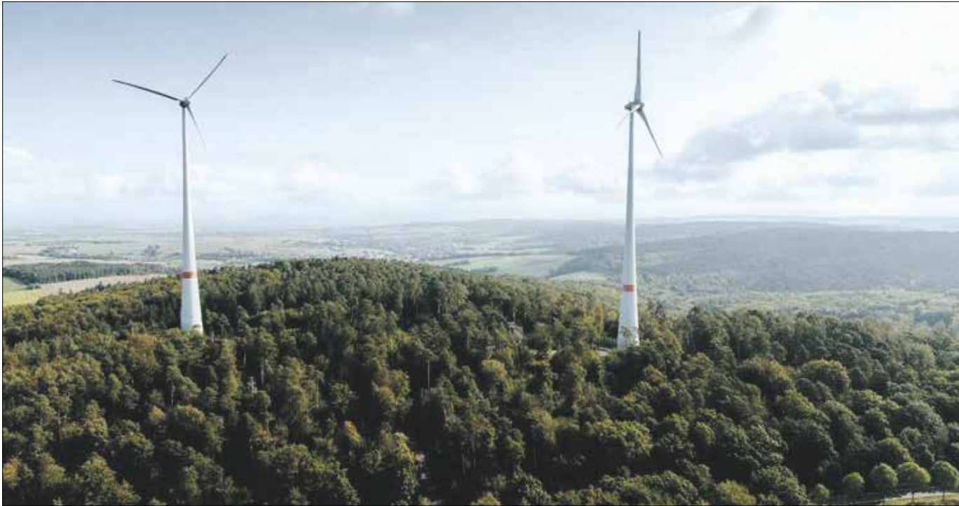
Bei Groß-Umstadt hat die ENTEGA Windenergieanlagen mit einer Leistung von zusammen vier Megawatt errichtet. Die Windräder des Windparks Binselberg erzielen einen Stromertrag von rund 11 Gigawattstunden pro Jahr.

keiten bis zur Erlangung der entsprechenden Genehmigung nach dem Bundesimmissionsschutzgesetz bei Windenergie oder für eine Baugenehmigung bei Photovoltaik. Um diese Genehmigung zu erhalten, müssen allerdings umfangreiche gesetzliche Prüfungen bezüglich der Umwelteinflüsse durchgeführt werden. Dazu gehört auch die enge Zusammenarbeit mit den betroffenen Gemeinden, um mögliche Widerstände zu minimieren. Durch Informationsver-