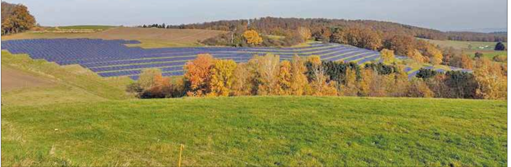
Der in Planung befindliche Bürgersolarpark Klein Bieberau (Gemeinde Modautal), ein gemeinsames Projekt von ENTEGA und Energiegenossenschaft Odenwald, er soll voraussichtlich Ende 2024 in Betrieb gehen.

Wind- oder Solarparks zu realisieren, ist ein komplexer Prozess: Eine sorgfältige Planung ist erforderlich, verschiedene Akteure müssen zusammenarbeiten und zahlreiche Faktoren berücksichtigt werden