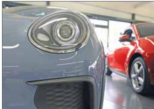
Elektrisch unterwegs.

Die E-Auto-Förderung 2024 setzt sich aus Bundesanteil samt Innovationsprämie und einem Herstelleranteil zusammen. Der Herstelleranteil ist ein Rabatt, der von den Herstellern gewährt wird und in der Regel 50 Prozent des Bundesanteils ausmacht,