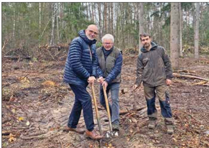
Mit vereinten Kräften wurden Bäume gepflanzt.

GROSS-GERAU – Mit einer groß angelegten Baumpflanzaktion hat Forstservice Taunus begonnen, im Auftrag der Kreisstadt Groß-Gerau mehrere Hektar Wald neu zu bepflanzen. Im Stadtwald werden insgesamt 4.000 neue Bäume gesetzt, rund 600 davon auf einer Fläche von 1.600 Quadratmeter mit Unterstützung des Lions Clubs Groß-Gerau.