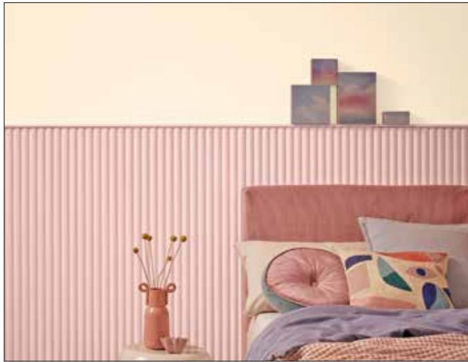
Mut zur Farbe.

Wandfarben sind eine einfache und effektive Art, Räume zu gestalten. Das heute schier unendliche Angebot an Wandfarben lässt dabei keine Wünsche offen. Es kann aber auch schnell überfordern, besonders wenn mehrere Farben parallel zum Einsatz kommen sollen.