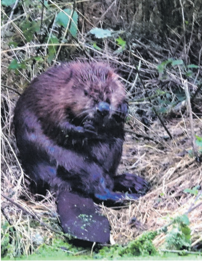
Der Biber hält Einzug am Bauerbach. deren Rinde ernährt er sich in den Wintermonaten. Aber er verschmäht auch keine Obstbäume, wie der NABU (Natur-

Seit einigen Monaten ist seine Anwesenheit am Bauerbach östlich der Bürgermeister-Mahr-Straße unübersehbar, wie der Blick vom nebenan verlaufenden Weg belegt. Der etwa einen Meter hohe aus Geäst errichtete Damm hat den Wasserspiegel in dem Bach deutlich ansteigen lassen, und der Biber hat mehrere zum Teil kräftige Weiden angenagt. Von