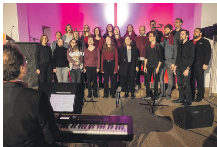
Unter anderem der „You Can Chor“ begeisterte die Zuhörer und sorgte für eine volle Kirche.