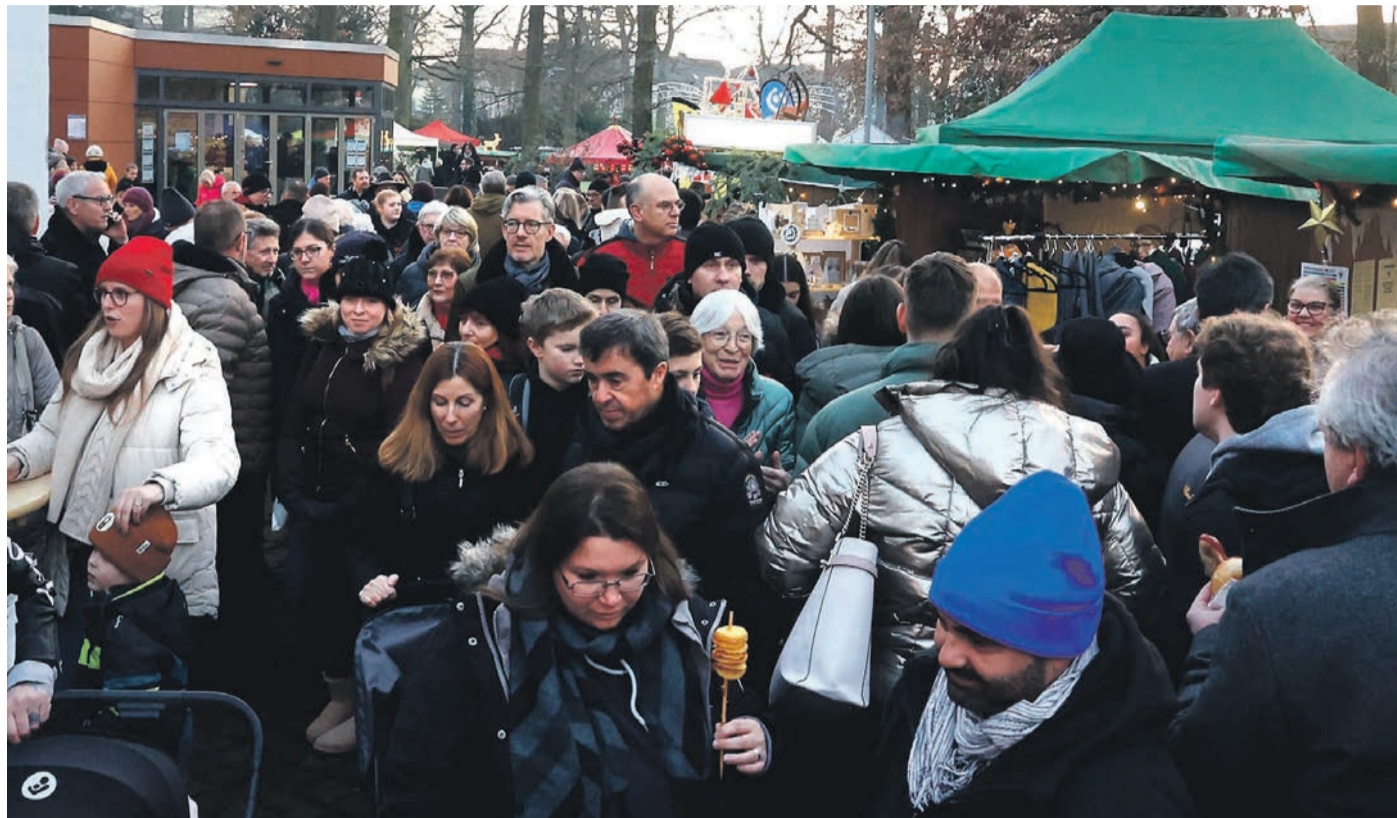
Rund um die Waldkirche herrschte ein regelrechter Ansturm von Besuchern.

Der Weihnachtsmarkt in Obertshausen richtete sich nicht nur an Erwachsene,