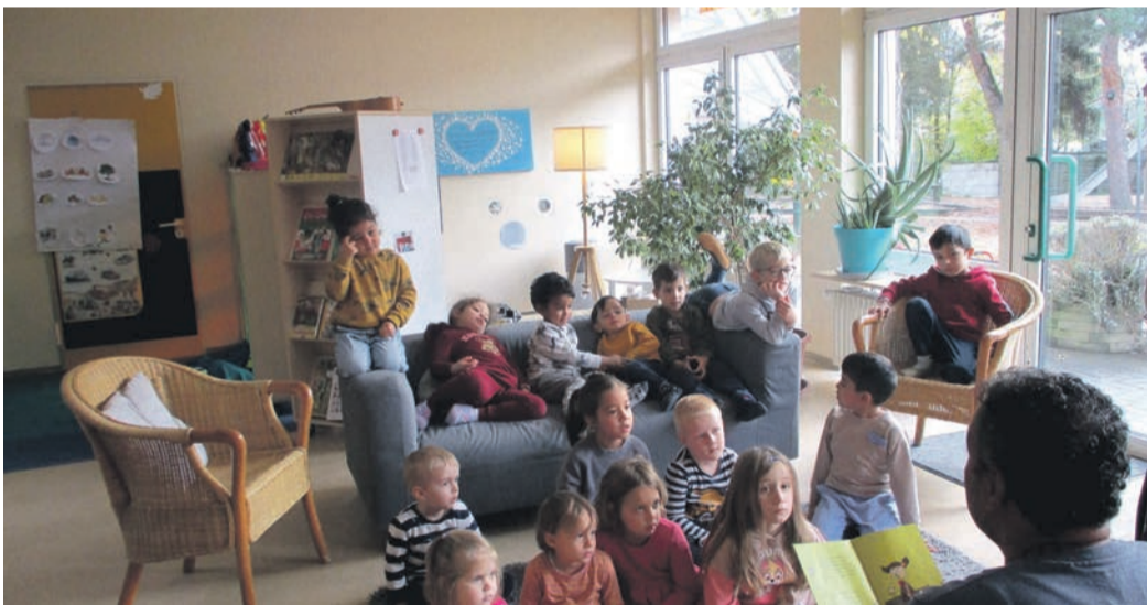
„Vorlesen verbindet“ war das Motto des diesjährigen bundesweiten Vorlesetages.