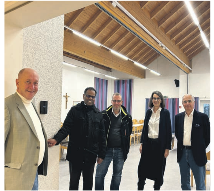
Das Pfarrheim erstrahlt nun innen und außen im neuen LED-Licht, ausgestattet mit Bewegungsmeldern und flexibler Steuerung.

Im September 2022 sagte die Nationale Klimaschutzinitiative des Bundesministeriums für Wirtschaft und Klimaschutz eine Förderung von rund 10.000 Euro zu. Die Umsetzung musste zunächst warten, weil ein Zulieferunternehmen Corona bedingt insolvent war. Ein neuer Zulieferer musste gefunden werden. Der veränderte Markt machte sich auch sehr deutlich an den gestiegenen Kosten bemerkbar. Die Investitionskosten beliefen sich auf rund 35.000 Euro. Der Verwaltungsrat hielt an dem Projekt fest, weil damit erhebliche Energiekosten eingespart werden. Der CO 2 -Ausstoß reduziert sich um rund 4 Tonnen im Jahr. Diese Argumente überzeugten auch das Bischöfliche Ordinariat, das zunächst die weiteren Schritte der Neugestaltung