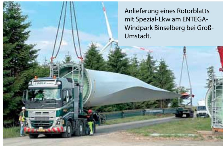
Anlieferung eines Rotorblatts mit Spezial-Lkw am ENTEGA-Windpark Binselberg bei Groß-Umstadt.

Die Projektierung umfasst bei der Windenergie die Auswahl geeigneter Windturbinen, die Positionie-