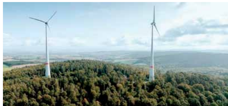
Bei Groß-Umstadt hat die ENTEGA Windenergieanlagen mit einer Leistung von zusammen vier Megawatt errichtet. Die Windräder des Windparks Binselberg erzielen einen Stromertrag von rund 11 Gigawattstunden pro Jahr.

rung im Gelände sowie die Infrastruktur für die Stromübertragung. Hier müssen sorgfältig die Größe, Leistung und Anzahl der Turbinen