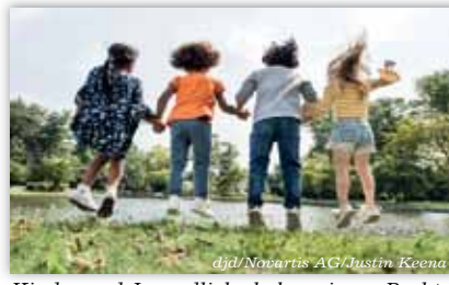
Kinder und Jugendliche haben eigene Rechte. Dies sollte auch für ihre Gesundheit gelten.

Zudem fehlt es an klinischen Studien für diese Altersgruppe. Sie sind Voraussetzung dafür, dass Kindermedikamente zugelassen werden. „Neue Wirkstoffe müssen genauestens