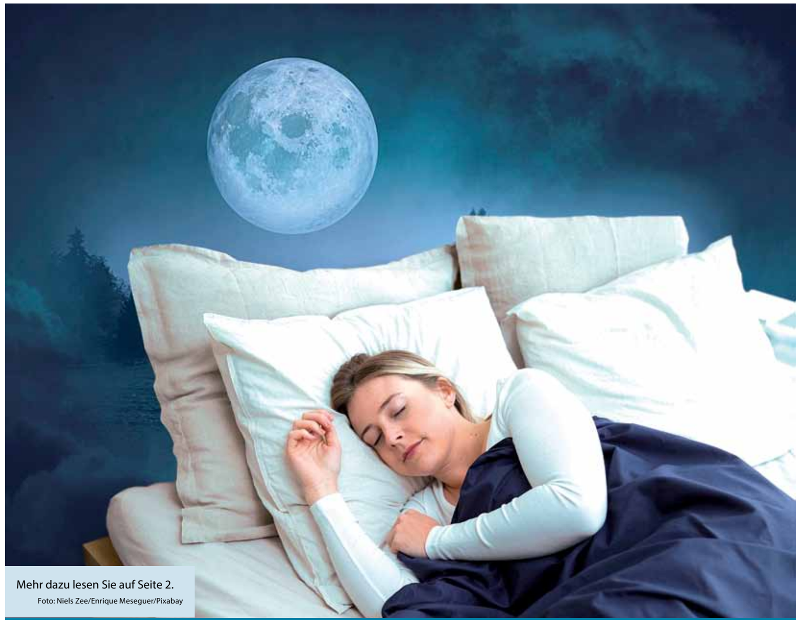
Mehr dazu lesen Sie auf Seite 2.

Mythos oder Wahrheit – Schlafen wir bei Vollmond wirklich schlechter?