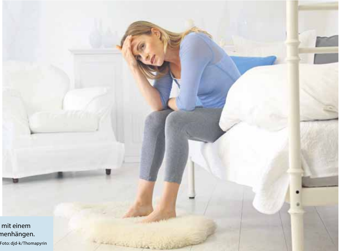
Wenn der Schädel brummt, kann das mit einem abfallenden Östrogenspiegel zusammenhängen.

(DJD-K). Genervt von den „Tagen“ und dann noch Kopfweh? Veränderte Migräne nach den Wechseljahren? Gar nicht selten. In einer aktuellen Befragung von 1.699 Frauen nannten 1.167 auch hormonelle Schwankungen als Auslöser ihrer Beschwerden. Rund 60 Prozent der Betroffenen sagten, dass in Phasen hormoneller Schwankungen ihre Kopfschmerzen und Migräne häufiger und langanhaltender auftreten. Ursachen könnten plötzlicher Östrogenabfall sein sowie hormonell bedingte Veränderungen in der Stressbewältigung. Zur schnellen, verträglichen Beschwerdelinderung haben sich etwa koffeinhaltige Schmerzmittel mit ASS und Paracetamol oder Ibuprofen – wie in Thomapyrin – bewährt. Vorbeugend können Entspannungsmethoden, Bewegung im Freien und ausreichendes Trinken helfen, mehr Tipps unter www.kopfschmerzen.de .