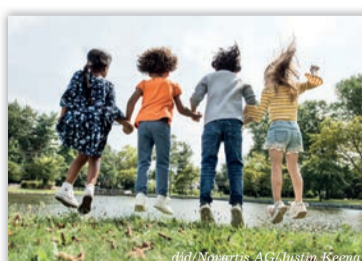
Kinder und Jugendliche haben eigene Rechte. Dies sollte auch für ihre Gesundheit gelten.

(djd-p). So steht es zumindest in der UN-Kinderrechtskonvention. Doch die Realität ist leider eine andere: Längst nicht alle Kinder haben Zugang zur bestmöglichen Gesundheitsversorgung – auch in Deutschland. Um die Arzneimittelversorgung unserer rund 14 Millionen Kinder und Jugendlichen zum Beispiel ist es nicht gut bestellt. Häufig gibt es keine eigens für sie zugelassene Therapie. Viel zu oft müssen Kinderärzte auf Erwachsenenmedizin zurückgreifen. Das birgt Risiken, denn die Präparate sind nicht auf den kindlichen Stoffwechsel angepasst, Nebenwirkungen können gravierender ausfallen. Zudem fehlt es an klinischen Studien für diese Altersgruppe. Sie sind Voraussetzung dafür, dass Kindermedikamente zugelassen werden. „Neue Wirkstoffe müssen genauestens