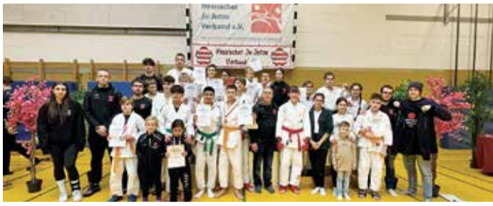
Das Ju-Jutsu Fighting Team des Judo-Clubs Erbach mit seinen Kämpfern.

Erbach. Am 9. Dezember trat das Ju-Jutsu Fighting Team des Judo-Club Erbach mit 20 Kämpfern bei den Hessenmeisterschaften in Maintal an. Das Erbacher Team erreichte mit starken Leistungen den 1. Platz