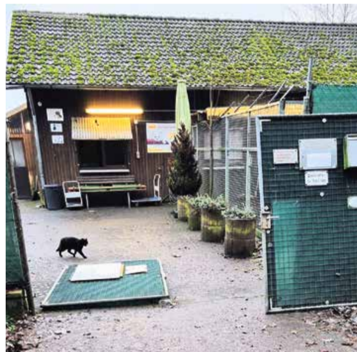
Mit brachialer Gewalt verschafften sich in der Nacht von Freitag auf Samstag Einbrecher Zugang zum Tierheim Würzburg und richteten dabei erheblichen Schaden an.