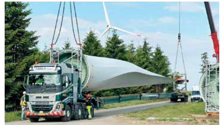
Anlieferung eines Rotorblatts mit Spezial-Lkw am Entega-Windpark Binselberg bei Groß-Umstadt.

Die Projektierung umfasst bei der Windenergie die Auswahl geeigneter Windturbinen, die Positionierung im Gelände sowie die Infrastruktur für die Stromübertragung. Hier müssen sorgfältig die Größe, Leistung und Anzahl der Turbinen bestimmt werden, um die optimale Energiegewinnung zu erzielen. Auch Auswirkungen auf die Umwelt und das Ökosystem,