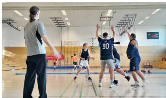
Intensive Situation am Ball auf dem Dragons Cup.

Michelstadt. Die Campus-Sporthallen wurden vor Kurzem zum Schauplatz eines besonderen Basketball-Events: Der Odenwald Dragons Cup begeisterte die Zuschauer mit Spielen und Show-Einlagen.