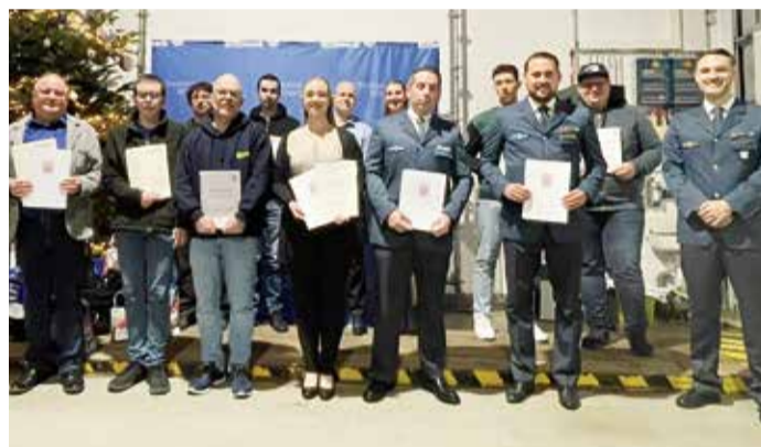
Ehrungen und positiver Rückblick beim THW.

würdigt das herausragende Dienstbereitschaft der Geehrten. Engagement und die zuverlässige red