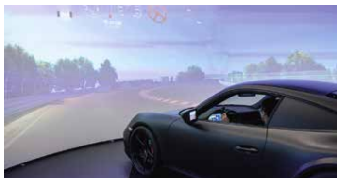
Virtuelle Testfahrten sollen Zeit, Geld und CO2 einsparen. Dafür investiert Pirelli in ein Virtual Development Center.

Breuberg. Pirelli eröffnet ein Virtual Development Center (VDC) am Standort in Breuberg mit rund 2.500 Mitarbeitern – darunter 250 Ingenieure in der Entwicklung.