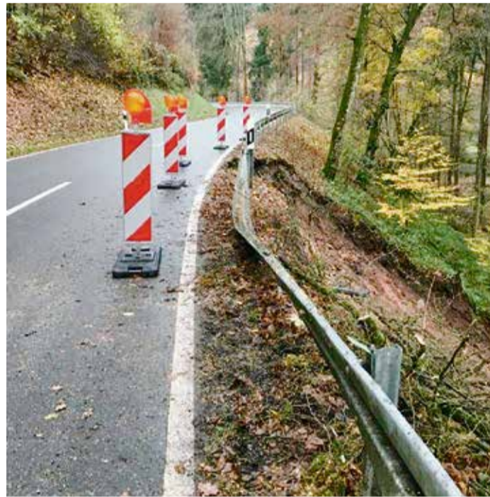
Hier rutschte die Erde ab.

Die Baukosten der Maßnahme belaufen sich auf rund 195.000 Euro. red