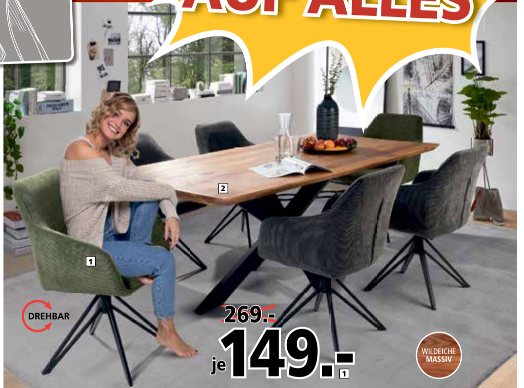
1 BRANCO Armlehnenstuhl Bezug: Cord anthrazit oder grün, Gestell Metall schwarz, drehbar 2 CARMELO 1 Esstisch Wildeiche massiv geölt, Gestell Metall schwarz, ca. 200x100 cm 1219.- 699.-