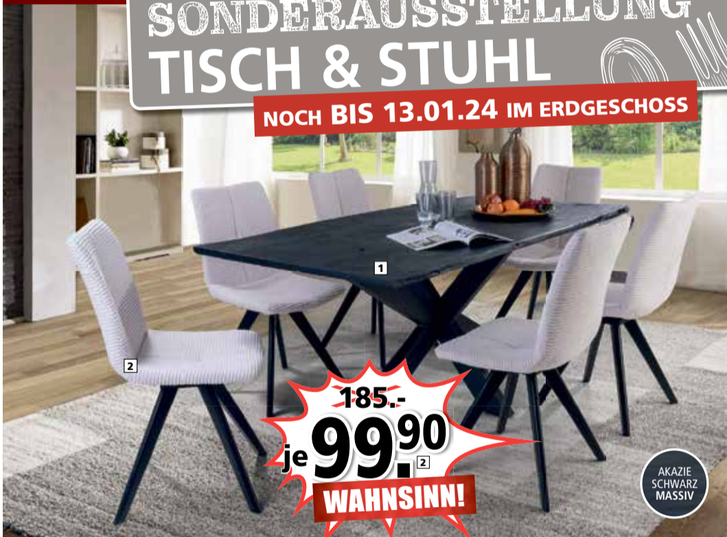
1 PALANI Esstisch Akazie massiv sandgestrahlt schwarz, mit Baumkante, Gestell Metall schwarz, ca. 180x90 cm 749.- 399.- 2 FRANKA 40 Stuhl Stoff Cord hellcreme, Gestell Buche schwarz.