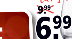
ALTEO Besteck-Set Cromargan Edelstahl 18/10, matt.

FLAMENCO Karaffe ca. 11x27x11 cm, Glas, mit Kork Deckel.