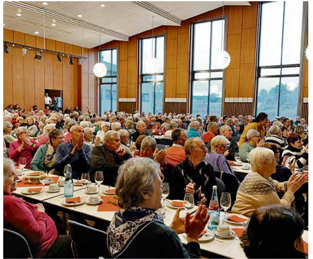
Knapp 400 Gäste folgten der Einladung zur gemeinsamen Seniorenadventsfeier von Michelstadt und Erbach.

Im Anschluss lauschten die Senioren der Weihnachtsgeschichte, gelesen von der Michelstädter Pfarrerin Dr.