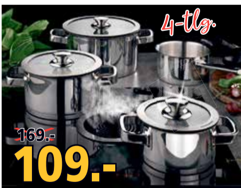
BONGUSTO 30 Topf-Set Edelstahl, 3x Topf mit Deckel, 1x Stielkasserolle.

CAILIN 17 Kochtopf-Set Edelstahl 18/10 glänzend, Bratentopf 20 cm, Fleischtopf 16/24 cm, Stielkasserolle 16 cm.