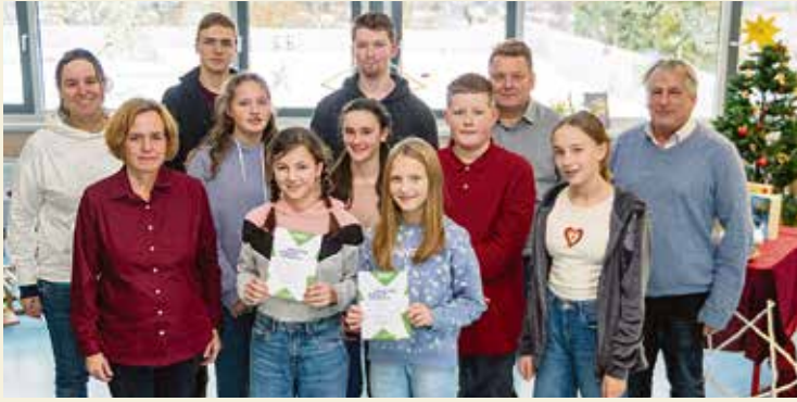
Teilnehmer und Jury des Vorlesewettbewerbs.