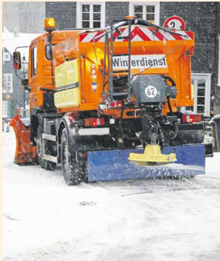
Der Winterdienst mit Feuchtsalz trägt maßgeblich zur Sicherheit im Straßenverkehr bei.