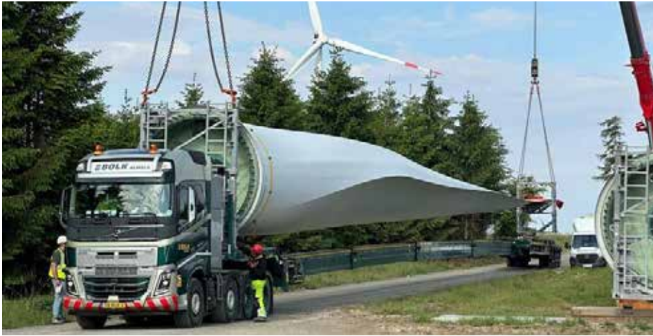
Anlieferung eines Rotorblatts mit Spezial-Lkw am ENTEGA-Windpark Binselberg bei Groß-Umstadt.

Mit der erfolgreichen Flächenakquisition beginnt die eigentliche Projektentwicklung, um den jeweiligen Wind- oder Solarpark nach zwei bis fünf Jahren errichten zu können. Die Projektentwicklung beinhaltet alle notwendigen Tätigkeiten bis zur Erlangung der entsprechenden Genehmigung nach dem Bundesimmissionsschutzgesetz bei Windenergie oder für eine Baugenehmigung bei Photovoltaik. Um diese Genehmigung zu erhalten, müssen allerdings umfangreiche gesetzliche Prüfungen bezüglich der Umwelteinflüsse durchgeführt werden. Dazu gehört auch die enge Zusammenarbeit mit den betroffenen Gemeinden, um mögliche Widerstände zu minimieren. Durch Informationsveranstaltungen wird für Akzeptanz in der Bevölkerung für die geplanten Projekte geworben, welche für den Projekterfolg sehr wichtig ist.