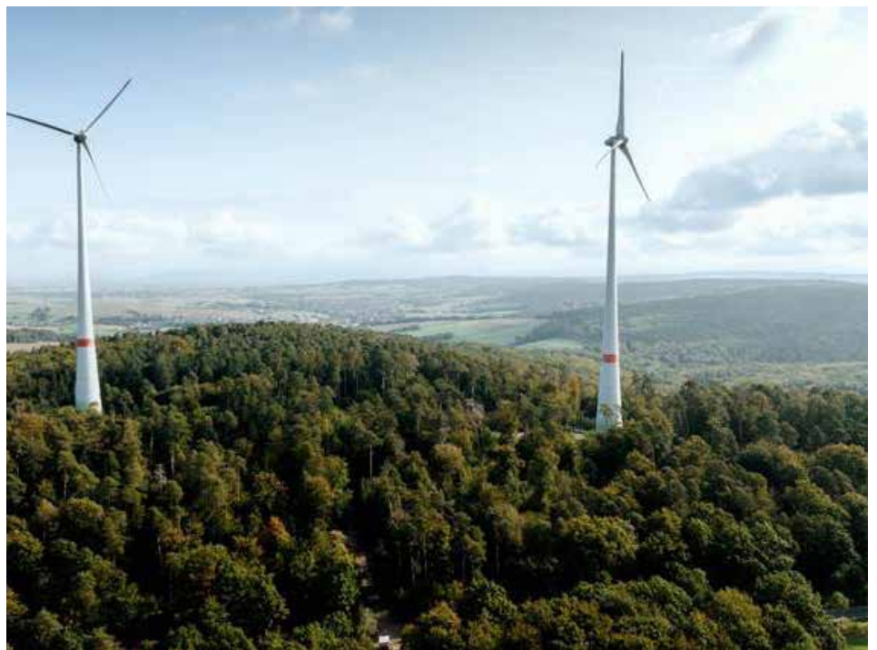
Bei Groß-Umstadt hat die ENTEGA Windenergieanlagen mit einer Leistung von zusammen vier Megawatt errichtet. Die Windräder des Windparks Binselberg erzielen einen Stromertrag von rund 11 Gigawattstunden pro Jahr.

Nach erfolgreicher Genehmigungserteilung und Zuschlag bei der Bundesnetz-