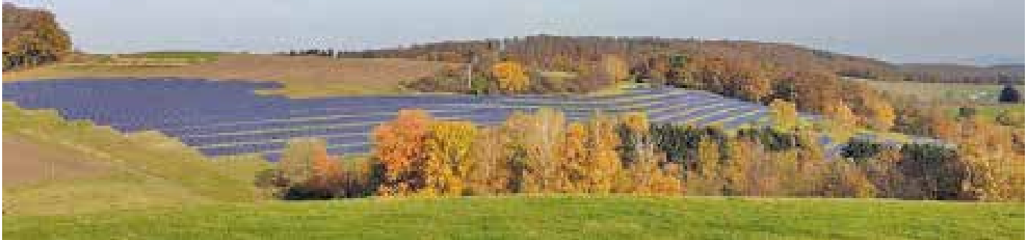
Der in Planung befindliche Bürgersolarpark Klein Bieberau (Gemeinde Modautal), ein gemeinsames Projekt von ENTEGA und Energiegenossenschaft Odenwald, er soll voraussichtlich Ende 2024 in Betrieb gehen.

Wind- oder Solarparks zu realisieren, ist ein komplexer Prozess: Eine sorgfältige Planung ist erforderlich, verschiedene Akteure müssen zusammenarbeiten und zahlreiche Faktoren berücksichtigt werden.