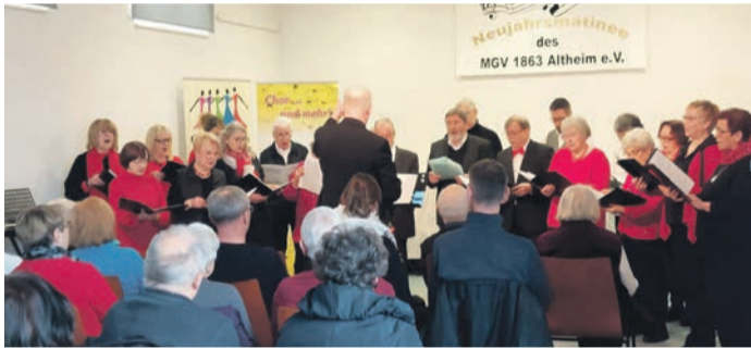
Neujahrsmatinee des MGV 1863 Altheim e.V. Die Vortragsgruppe singt auf der Bühne.