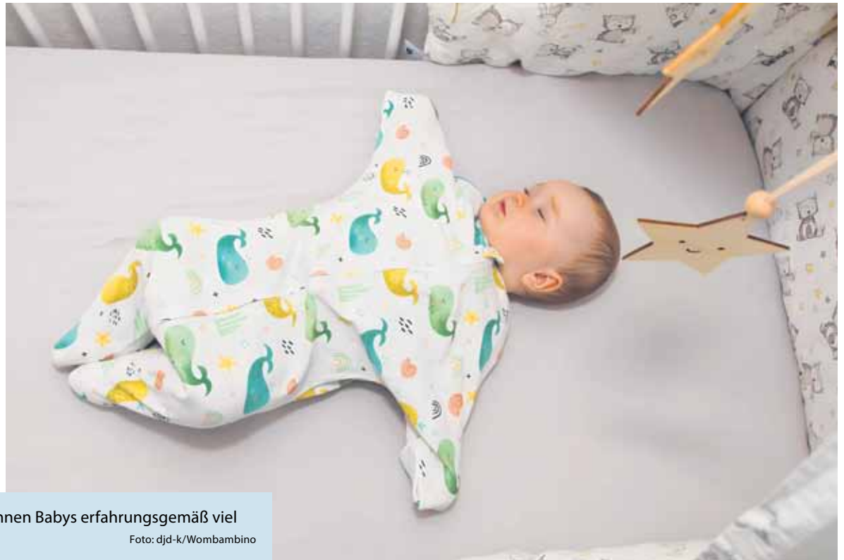
Geborgen und kuschelig umhüllt können Babys erfahrungsgemäß viel besser ein- und durchschlafen.

(DJD-K). Eltern werden ist ein wundervolles Abenteuer – aber bedeutet auch eine enorme Umstellung. Waren wir vor der Geburt des Babys noch weitgehend selbstbestimmt, dreht sich nun alles um die Bedürfnisse des Neunkömlings. Eine der größten Herausforderungen ist der Schlaf des Kleinkinds. Schläft es schlecht ein und schreit die halbe Nacht, kommen Eltern oft an ihre Grenzen. Was vielen nicht bewusst ist: Auch für die Kleinen ist alles neu, ihnen fehlt die Geborgenheit in Mamas Bauch. Abhilfe kann hier der Wombi schaffen. Als geschlossener Babyschlafsack ist er eine natürliche Hülle und vermittelt sowohl Sicherheit als auch Bewegungsfreiheit – fast wie im Mutterleib. Mehr Infos: www.wombambino.de . Zudem können Einschlafrituale wie Singen, Kuseln und feste Bettzeiten den Schlummer fördern.