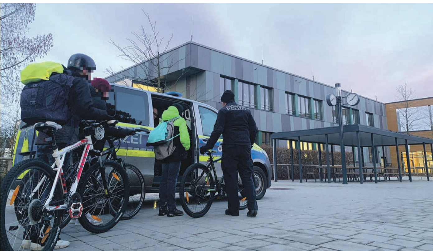
Bei 46 von 100 kontrollierten Fahrrädern vor der Schule auf der Aue gab es etwas zu beanstanden, meist mangelnde Beleuchtung.

Münster (MA) In dieser Woche hat die Schule wieder begonnen und viele Kinder sind mit dem Fahrrad auf dem Weg zum Unterricht. Wenn die Räder nicht verkehrssicher sind, kann es im Straßenverkehr schnell gefährlich werden. In einer gemeinsamen Aktion von Ordnungspolizei der Gemeinde Münster, Polizei Dieburg und Schule auf der Aue wurden daher am vergangenen Dienstagmorgen vor Unterrichtsbeginn wieder stichprobenartig Fahrräder