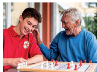
Durch regelmäßige Besuche helfen Ehrenamtliche älteren Menschen dabei, Demenz, sozialer Isolation und Bewegungsmangel entgegenzuwirken.

zusammengekommen, um Bedürftigen deutschlandweit zu helfen. Das Geld geht direkt an die lokalen Hilfsprojekte des DRK, zum Beispiel für die aktivierenden Hausbesuche in Süd-West-Deutschland. Die Kooperation zwischen STADA und dem DRK wird auch 2024 fortgesetzt. Jeder kann mit dem Kauf eines Medikaments aus dem OTC-Generikasortiment von STADA die Initiative unterstützen.