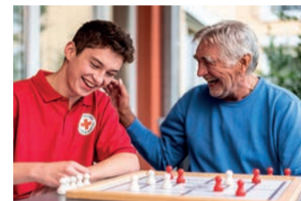
Durch regelmäßige Besuche helfen Ehrenamtliche älteren Menschen dabei, Demenz, sozialer Isolation und Bewegungsmangel entgegenzuwirken.

zusammengekommen, um Bedürftigen deutschlandweit zu helfen. Das Geld geht direkt an die lokalen Hilfsprojekte des DRK, zum Beispiel für die aktivierenden Hausbesuche in Süd-West-Deutschland. Die Kooperation zwischen STADA und dem DRK wird auch 2024 fortgesetzt. Jeder kann mit dem Kauf eines Medikaments aus dem OTC-Generikasortiment von STADA die Initiative unterstützen.