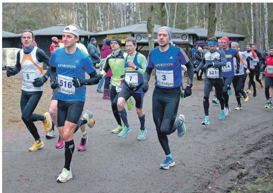
Rund um die Gänsbrüh wird am 27. Januar wieder alles gegeben.

„Der Weinladen“ - Ludwig-Erhard-Platz 2-4 Richard Subtil, Tel. 23479 Außerdem über: karten@maennerchor-dudenhofen.de Die Plätze sind an nummerierten Tischen, deren Standort kurz vor der Veranstaltung ausgelost wird.