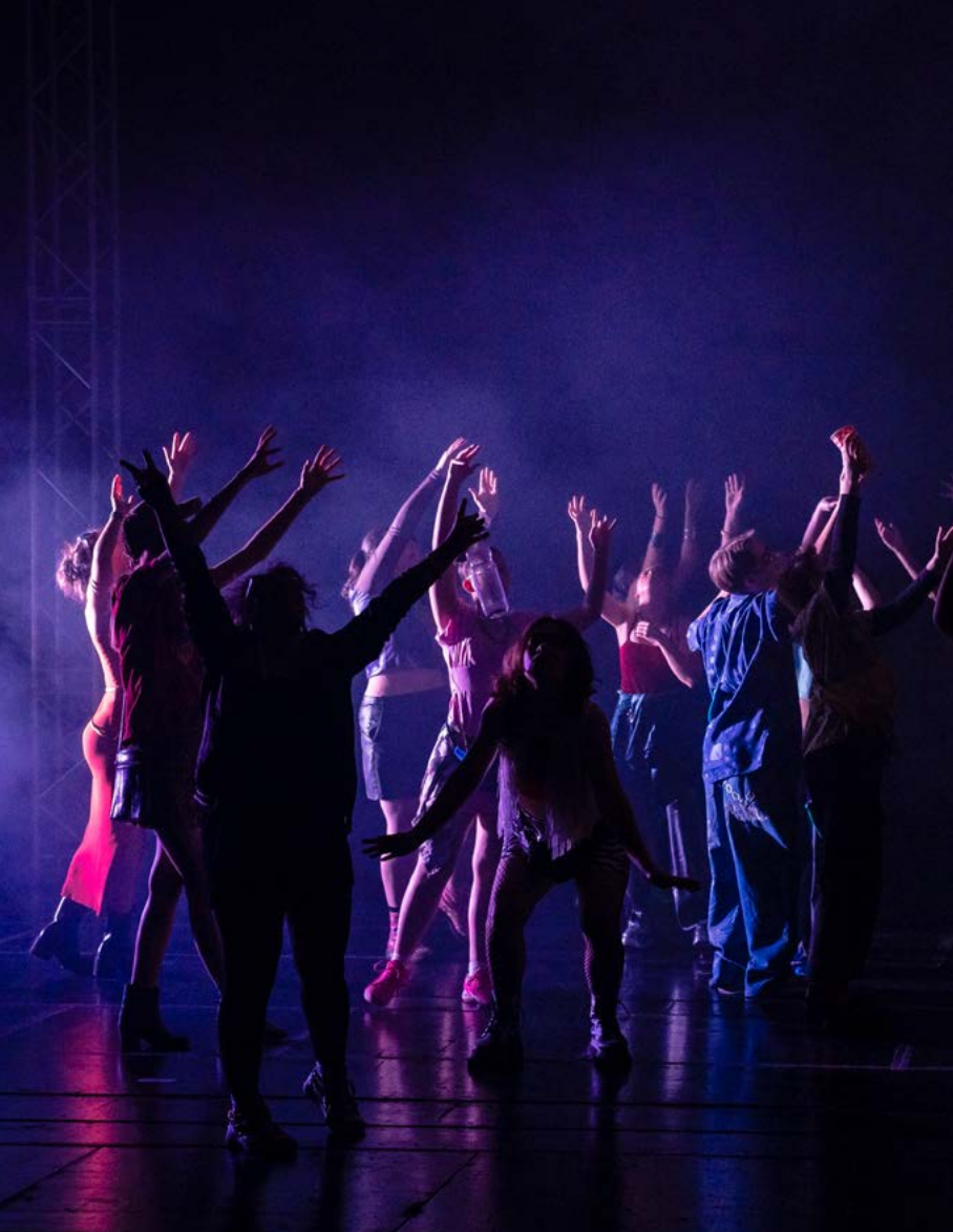
Jugendchor und Statisterie des Staatstheaters Darmstadt