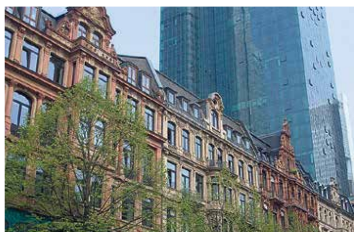
Restaurierte Gründerzeitfassaden vor dem Gallileo-Hochhaus

Früher in der Münchener Straße 32 ansässig, befindet sich YokYok heute in zentraler Lage am Hauptbahnhof 6. Ein Anblick, der Passanten innehalten lässt und eine neugierige Menschenmenge versammelt. Dies ist jedoch kein zufälliges Zusammentreffen, sondern das lebendige Treiben vor dem bekanntesten Kiosk Frankfurts. Dank seiner Präsenz in der ProSieben-Sendung "taff" erlangte YokYok Popularität. Der Kiosk überzeugt mit einer breiten Palette an Spirituosen, darunter auch ungewöhnliche Sorten, die in gewöhnlichen Läden