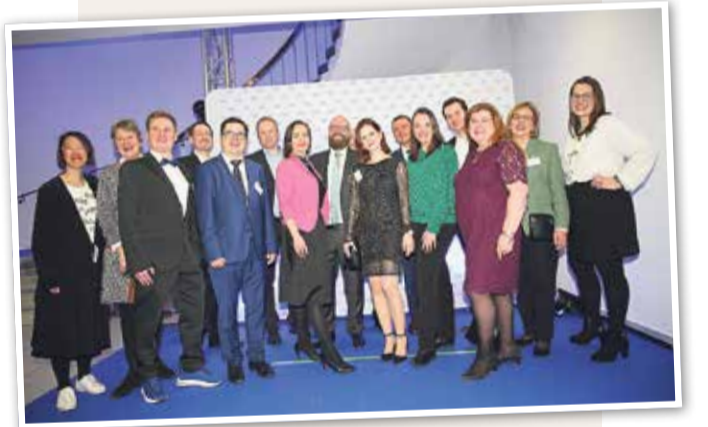
Wirtschaftsjunioren der IHK Frankfurt