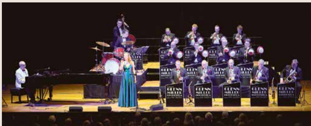
Best Of mit Sängerin

DER FRANKFURTER verlost je 3 x 2 Tickets