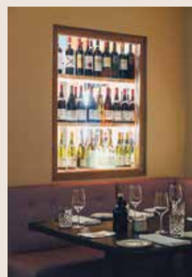
Der elegante Innenraum des Le Petit Royals

Im Le Petit Royal Frankfurt, dem ersten Restaurant der renommierten Grill Royal-Gruppe außerhalb Berlins, verschmelzen regionale und internationale Steaks, Meeresschalen sowie frischer Fisch zu einer einzigartigen Gaumenfreude. Moderne Interpretationen französischer Klassiker begeistern, begleitet von hausgemachten Saucen und saisonalem Gemüse im unverkennbaren Grill Royal-Stil. Nicht nur die exquisite Speisekarte beeindruckt, sondern auch das elegante Ambiente des Restaurants. Speziell gefertigte Polstermöbel, klassische Ikoraleuchten und zeitgenössische Kunstwerke schaffen eine Atmosphäre der Exklusivität. Le Petit Royal Frankfurt, beheimatet in einer Gründerzeitvilla am Rande des Bahnhofsviertels, bietet die ideale Kulisse für Business-Essen und besondere Anlässe. Die umfangreiche deutsch-französische Weinkarte mit über 350 sorgfältig ausgewählten Weinen und Champagnern setzt gekonnt Akzente und lädt zu einem unvergesslichen kulinarischen Erlebnis ein.