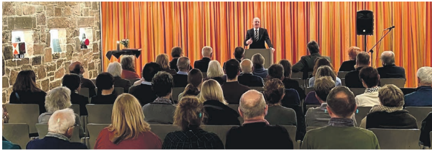
Viel Zulauf hatte die Veranstaltung des Ökumenischen Arbeitskreises und der Gemeinde Eppertshausen zum Gedenktag an die Opfer des Holocaust.

Die Jahreshauptversammlung der Einsatzabteilung findet am Freitag, 16. Februar, um 19.30 Uhr im Feuerwehrhaus statt. Tagesordnung: Begrüßung und Eröffnung, Bericht des Gemeindebrandinspektors, Verschiedenes Im Anschluss an die Jahreshauptversammlung der Einsatzabteilung findet die Mitgliederversammlung des Feuerwehrvereins statt. Die Jahreshauptversammlung findet in Dienstkleidung statt.