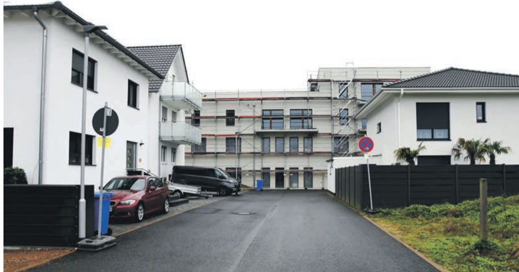
Im Eppertshäuser Baugebiet „Am Abteiwald“ wächst inmitten von Wohnhäusern das Caritas Seniorenzentrum heran. Das Foto zeigt das kleinere und niedrigere Gebäude, in dem zwölf der 38 barrierefreien Wohnungen untergebracht werden.