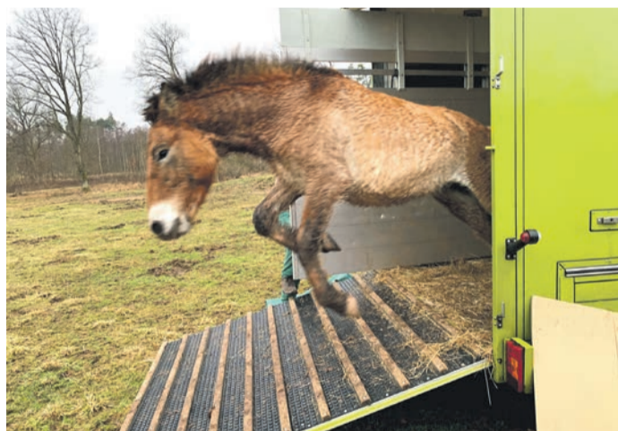
endlich verlassen und ihr neues Zuhause erkunden konnten. Die Neuankömmlinge wurden neugierig von den elf „Altein-

Münster (MA) Herzlich Willkommen in Münster“ an vier ganz besondere Mitbewohner namens Wero, Wolodymyr, Wotan und Willy. Die vier jungen Przewalski-Hengste sind Ende vergangener Woche zu ihren elf Artgenossen auf Muna-Gelände im Wisentwald Münster eingezogen. Wero, Wolodymyr und Wotan kommen aus Schweinheim und kennen sich daher schon, Willy ist aus Gießen in seine neue Heimat gebracht worden. Die Tiere freuten sich sichtlich, als sie die Transportanhänger