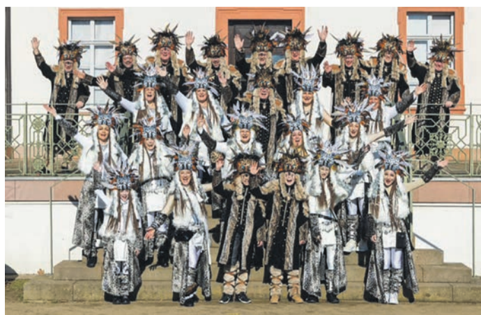
wuchsfastnachter zu einem einzigartigen Erlebnis. Das Motto für die Kampagne 2023/2024 lautet: „Die Sonne aus dem Herzen scheint, wenn das Äla uns vereint“. Auch die

Münster (MA) Eine Woche vor den närrischen Tagen findet sonntags traditionell der Kinderumzug in Dieburg statt. Er ist einer der Höhepunkte der „Dibbojer Fassnacht“ und sorgt jedes Jahr für ein närrisches Spektakel auf den Straßen der südhessischen Karnevalshochburg. Zahlreiche Schulkassen, Kindergärten, Fastnachtsgruppen und natürlich das Kinder-Prinzenpaar präsentieren sich dem närrischen Publikum. 43 Zugnummern und tausende von Zuschauern machen den „kleinen Umzug“ der Nach-