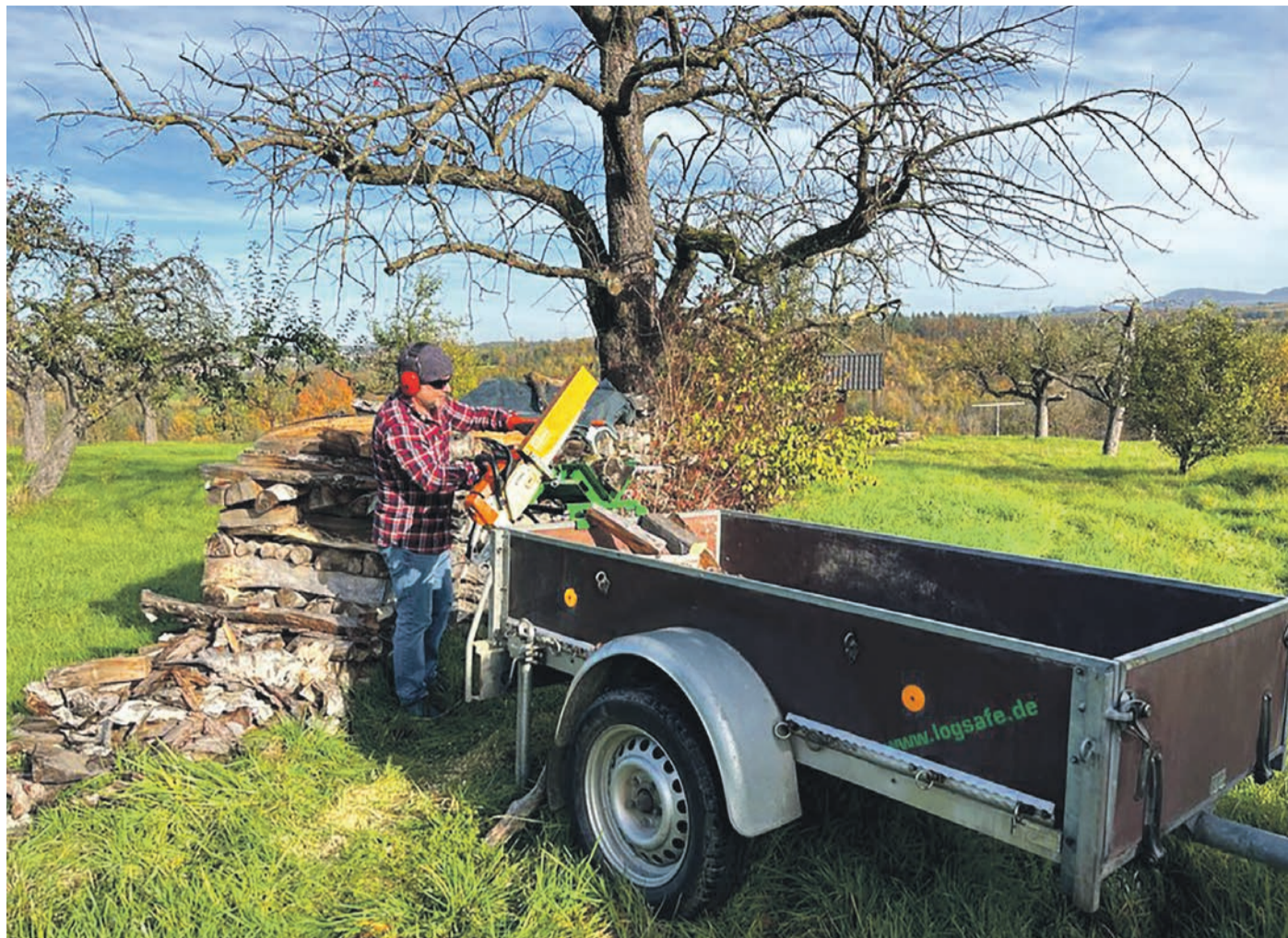
Holzarbeiten gehen leichter von der Hand, wenn die Brennholzscheite direkt von einem Sägebock in den Transporthänger fallen.

Finanziell besonders interessant ist das Heizen mit dem nachwachsenden Rohstoff, wenn man selbst Holz macht. Wo dies möglich ist, wissen regionale Förster und Forstämter. Holz einzuschlagen, auf die richtige Länge zu bringen und zu spalten, erfordert körperlichen Einsatz. Echte Hol-