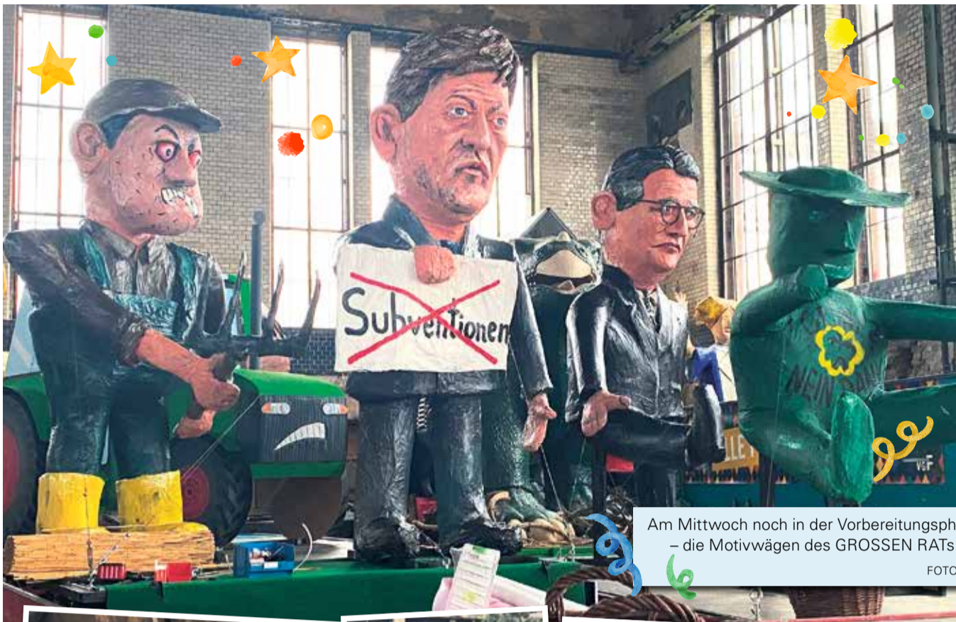
Am Mittwoch noch in der Vorbereitungsphase – die Motivwägen des GROSSEN RATS.

Frankfurter Fastnachtszug läuft Sonntag ab 12:21 Uhr durch die Innenstadt