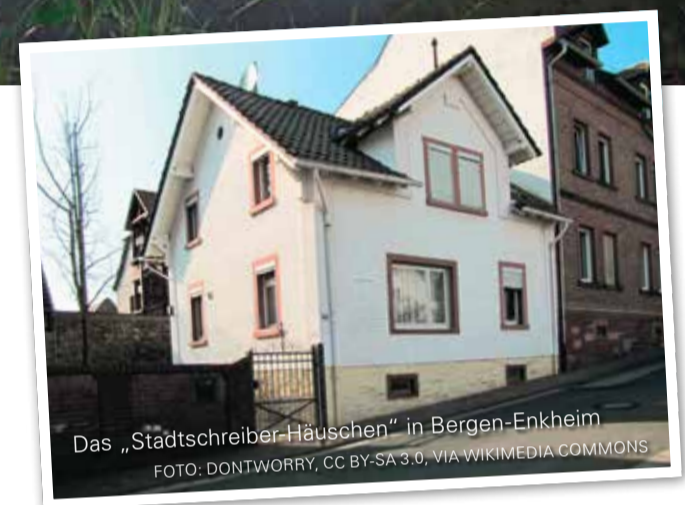
Das „Stadtschreiber-Häuschen“ in Bergen-Enkheim

Das Hessen-Center ist ein Einkaufsparadies mit einer Verkaufsfläche von fast 39.000 Quadratmetern und rund 115 Shops auf drei Etagen. Der Branchenmix ist vielfältig und auf die Region zugeschnitten, so dass große Bekleidungsgeschäfte, kleine Modeboutiquen sowie diverse Fachgeschäfte vertreten sind. Für eine Pause zwischen den