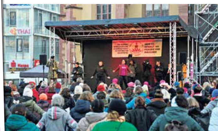
Eindruck vom V-Day 2023: Tanzdemo an der Hauptwache.