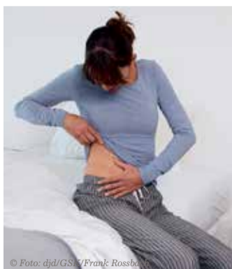
Viele denken, dass es sich bei Gürtelrose vor allem um einen lästigen Hautausschlag handelt – und sind dann von den starken Nervenschmerzen überrascht.

Mehr als 95 Prozent der Erwachsenen haben in ihrer Kindheit eine Windpockenerkrankung durchgemacht und tragen den Gürtelrose-Erreger in sich. Mehr als ein Viertel der Befragten über 50 Jahren glaubt,