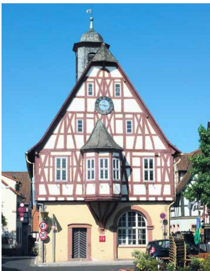
Das Wahrzeichen des Ortes: das Historische Rathaus

Zustellhotline: Tel. 06104-4970-0 Mo. – Fr. 8.00 – 16.30 Uhr