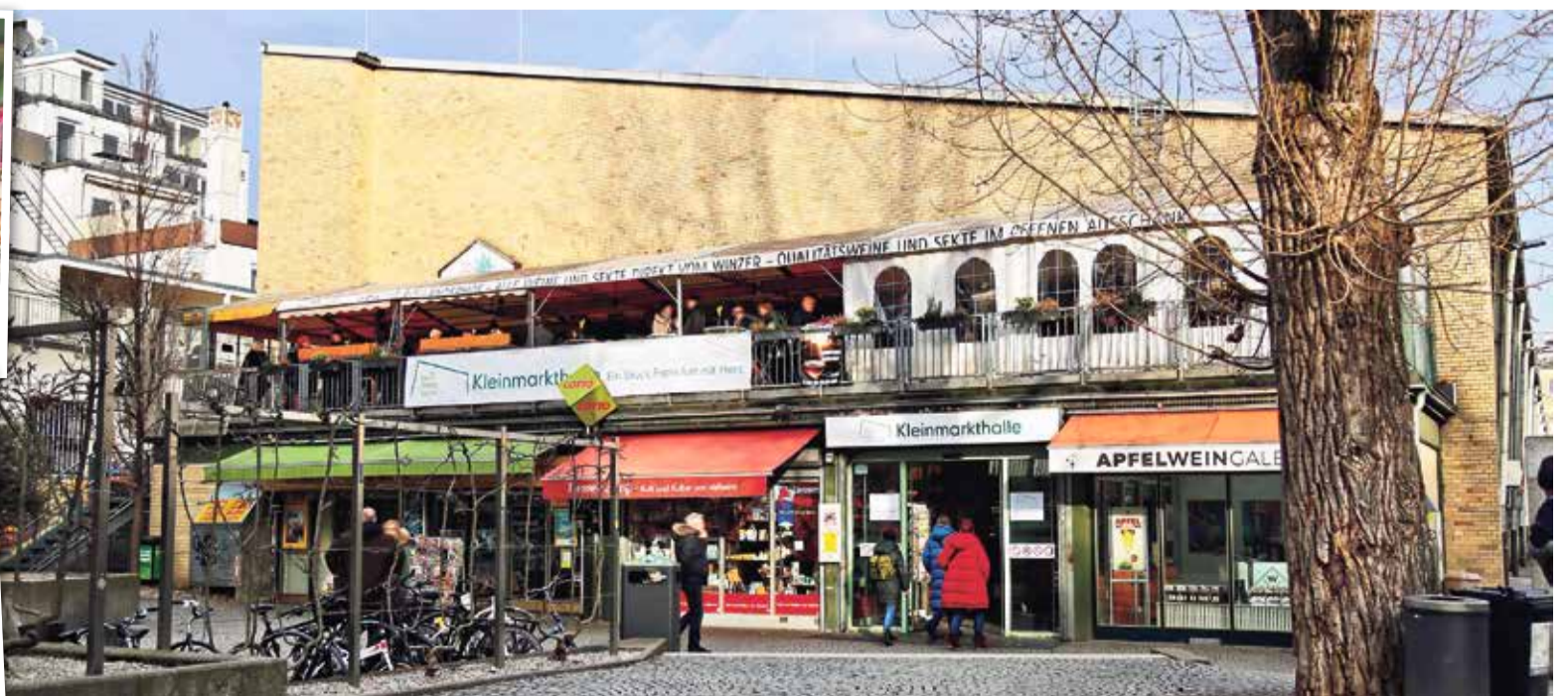
Außenansicht und Stände in der Kleinmarkthalle.