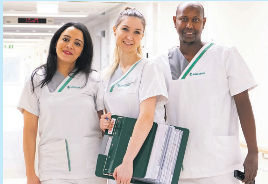
Pflegefachkräfte der Asklepios Klinik Langen

Zudem ist der Beruf als Pflegefachkraft extrem familienkompatibel und ein Wiedereinstieg z.B. auch nach einer längeren Familienpause in vielen Kliniken durch spezielle Arbeitszeitmodelle