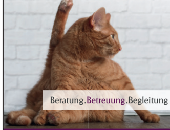
Beratung. Betreuung. Begleitung

Bei uns wird nichts über das Knie gebrochen. Wir nehmen uns Zeit für die persönliche Beratung.