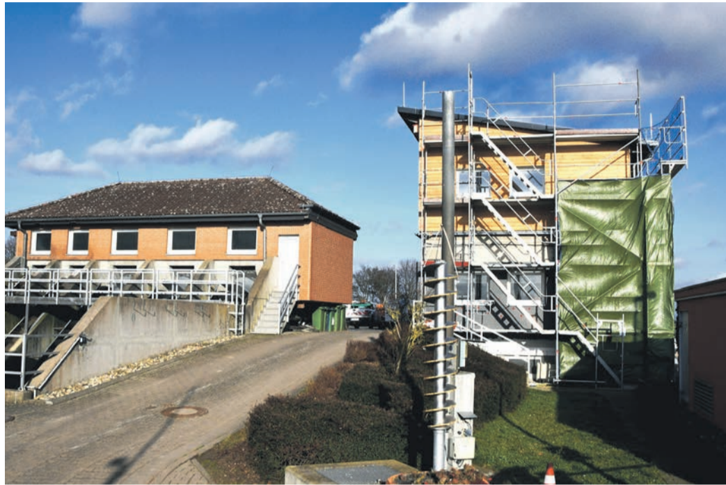
Das neue Betriebsgebäude der Münsterer Kläranlage wächst zusehends. Es zählt zu den aktuell größten Investitionen der Gemeinde.