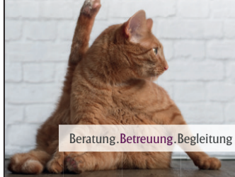
Beratung, Betreuung, Begleitung

Bei uns wird nichts über das Knie gebrochen. Wir nehmen uns Zeit für die persönliche Beratung.