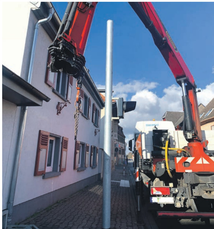
in den letzten Monaten starke bedanken uns bei allen Verkehrsteilnehmern für ihre

Über den Tag standen noch restliche Aufräumarbeiten an, um die Baustellenampeln zu entfernen. „Wir wissen, dass die provisorische Ampelschaltung und die damit verbundenen Beeinträchtigungen insbesondere auch für Fußgänger