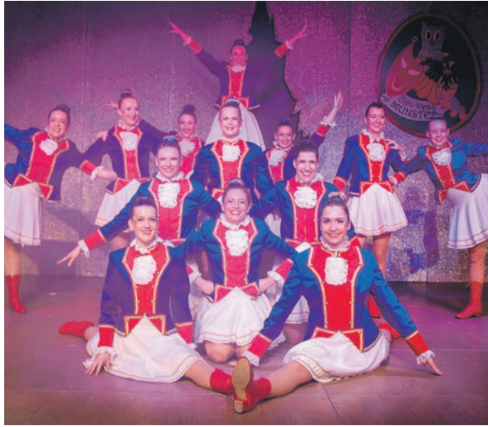
Die Garde begeisterte die Besucher und Besucherinnen der drei Fastnachtssitzungen der DJK Münster.