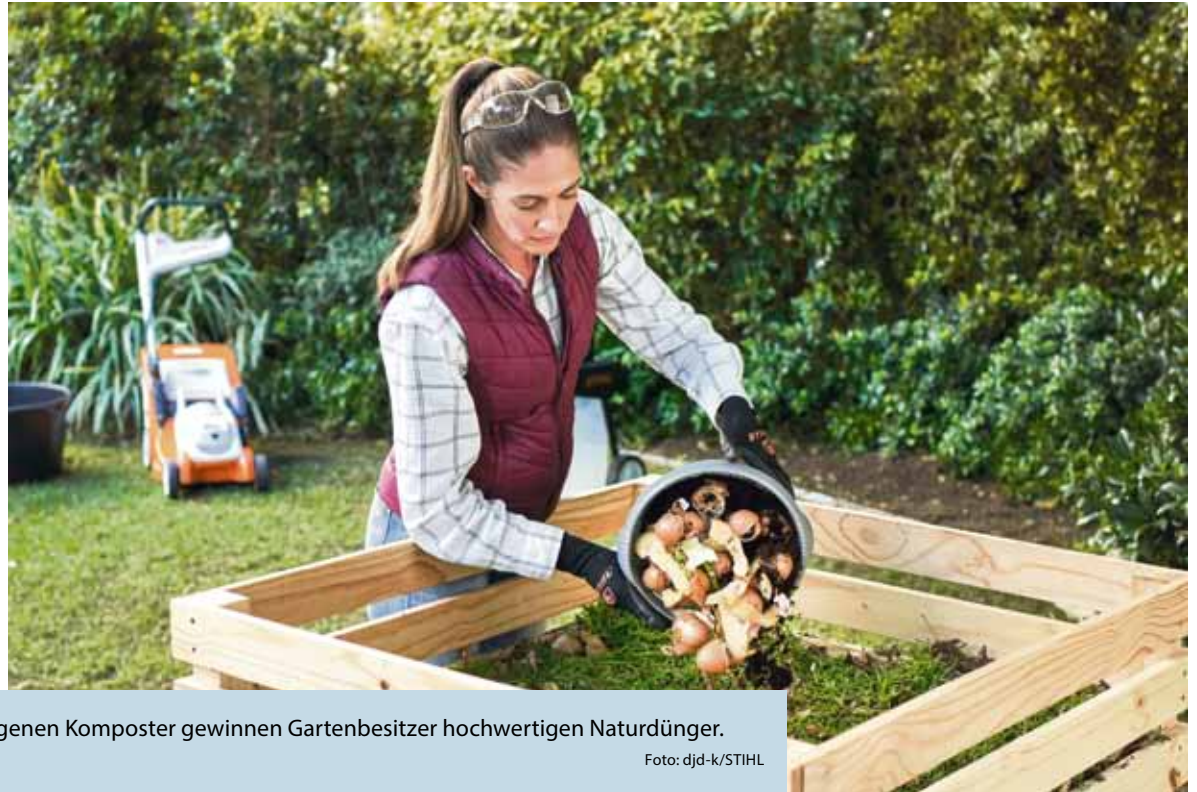
Recycling in Reinkultur: Mit einem eigenen Komposter gewinnen Gartenbesitzer hochwertigen Naturdünger.

(DJD-K). Warum immer wieder Dünger kaufen, wenn die Natur hochwertige Materialien quasi frei Haus liefert? Mit einem Komposter lässt sich das sprichwörtliche Gold des Gartens selbst gewinnen. Der dabei entstehende Humus ist ein wertvoller Dünger. „Er sorgt für lockere und nährstoffreiche Böden, ist ein effektiver Wasserspeicher und fördert insgesamt ein gesundes Pflanzenwachstum“, erläutert der Stihl-Gartenexperte Jens Gärtner. Obst- und Gemüseabfälle aus der Küche lassen sich ebenso in Humus verwandeln wie Schnittgut aus dem Garten. Ein Häcksler hilft, große Äste für den Komposthaufen zu zerkleinern. Den Komposter können Gartenbesitzer entweder als fertigen Behälter kaufen oder aus Holz selbst bauen. Wie das unkompliziert gelingt, erklärt eine Anleitung etwa unter www.stihl.de .