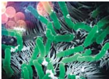
Mikroskopbild: Bakterienstamm B. bifidum MIMBb75

Beim Reizdarmsyndrom handelt es sich keineswegs um eine neue Zivilisationskrankheit oder gar eine Modeerscheinung. Schon Hippokrates, oft als „Vater der modernen Medizin“ bezeichnet, beschrieb bereits vor über 2000 Jahren einen Patienten mit Abdominalbeschwerden, verändertem Stuhlverhalten, Blähungen und Stuhldrang – kurz: mit typischen Reizdarmsymptomen. Die Ursache jedoch blieb für ihn rätselhaft.