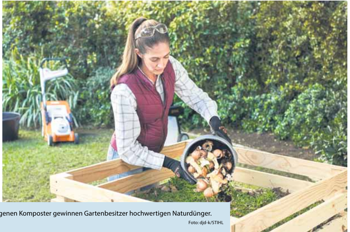
Recycling in Reinkultur: Mit einem eigenen Komposter gewinnen Gartenbesitzer hochwertigen Naturdünger.

(DJD-K). Warum immer wieder Dünger kaufen, wenn die Natur hochwertige Materialien quasi frei Haus liefert? Mit einem Komposter lässt sich das sprichwörtliche Gold des Gartens selbst gewinnen. Der dabei entstehende Humus ist ein wertvoller Dünger. „Er sorgt für lockere und nährstoffreiche Böden, ist ein effektiver Wasserspeicher und fördert insgesamt ein gesundes Pflanzenwachstum“, erläutert der Stihl-Gartenexperte Jens Gärtner. Obst- und Gemüseabfälle aus der Küche lassen sich ebenso in Humus verwandeln wie Schnittgut aus dem Garten. Ein Häcksler hilft, große Äste für den Komposthaufen zu zerkleinern. Den Komposter können Gartenbesitzer entweder als fertigen Behälter kaufen oder aus Holz selbst bauen. Wie das unkompliziert gelingt, erklärt eine Anleitung etwa unter www.stihl.de .