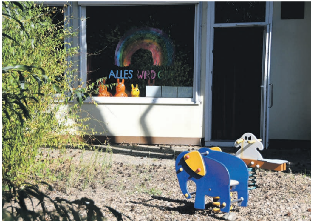
„Alles wird gut“, steht auf diesem Foto auf einem Fenster der Münsterer Kita St. Michael. In Sachen Kita-Gebühren droht es für Familien finanziell demnächst aber schlechter - spricht teurer - zu werden.

Im Ü3-Bereich soll in diesem Zuge die Gebührenbefreiung ab der siebten Betreuungsstunde entfallen. Die ersten sechs Stunden pro Tag blieben auch künftig gebührenfrei. Wer eine zusätzliche Stunde Betreuung für sein Kind ab dem vollendeten dritten Lebensjahr haben möchte, müsste nach dem Vorschlag der Verwaltung künftig 22,75 Euro monatlich bezahlen. Auch im U3-Bereich sollen die Gebühren steigen. Für die CDU nannte Thorsten Schrod dies in der Haushaltsdebatte „eine kleine Erhöhung“. Im Ü3-Bereich mache sie nur eine Regelung aus jener Zeit rückgängig, in der SPD und ALMA in der Münsterer Gemeindevertretung noch die Mehrheit gehabt und eine Gebührenbefreiung bei einer Betreuungszeit von bis zu sieben Stunden täglich durchgesetzt hatten. „Das fand