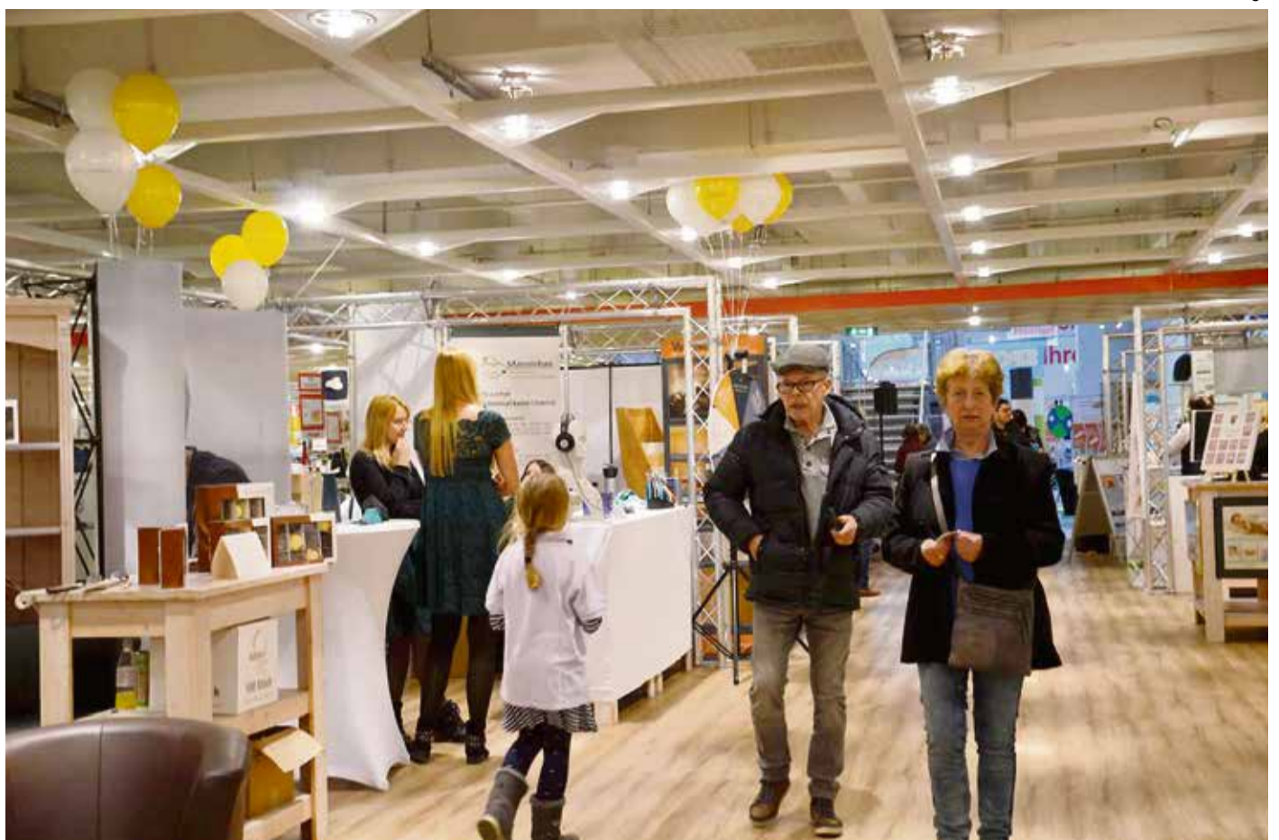
Ein Einblick in die Ausstellung: Viel für Jung und Alt für Erholung und Fitness.