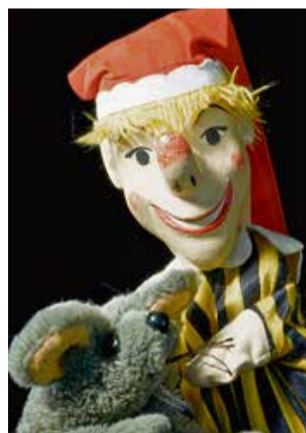
Kasperle und Maus.

unter http://www.kindertheater-papiermond.de und unter Tel.: 0172-9724456“. red