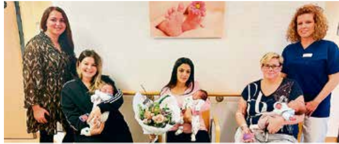
Drei Neujahrsbabys in einer guten Stunde. Seite 7

Anzeige auf Parteibüro: Grünen-Geschäftsstelle mit brauner Farbe beschmiert. Seite 6