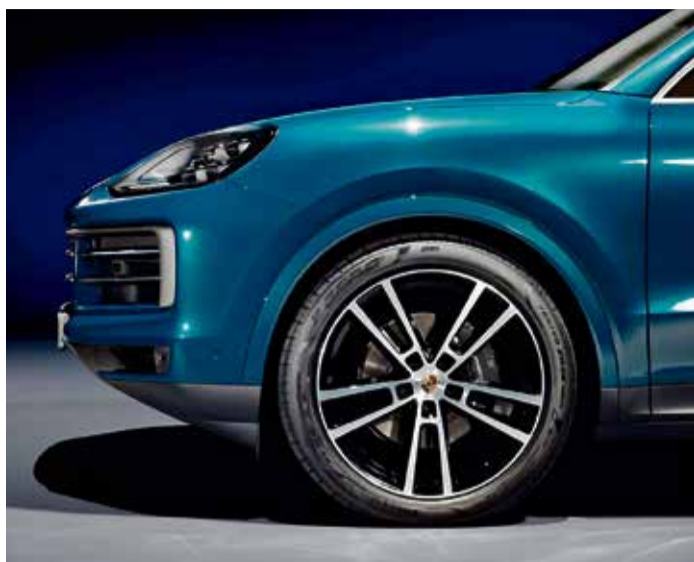
Blickfang mit Grip: Der P Zero aus Breuberg.

Drei weitere Produkte kommen aus Breuberg