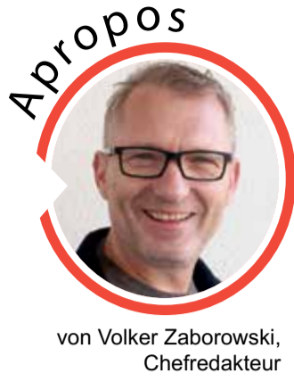
von Volker Zaborowski, Chefredakteur