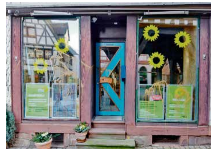
Vandalen beschmierten Scheibe und Fassade.