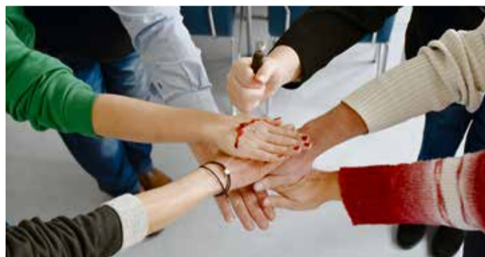
Blutig geht es zu in Krimis - Schriftsteller und Interessierte können beim Wettbewerb teilnehmen.

Beiträge werden bis zum 31. März gesammelt