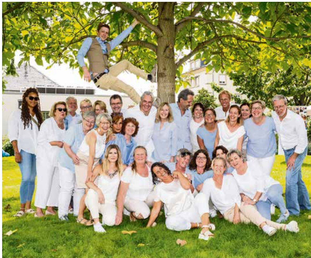
Der Chor „Spirit of Sound“

scheidungsgrundlage für die wohl größte Investition des Lebens. „Dabei wird von den VQC-Sachverständigen nicht nur eine Ist-Analyse durchgeführt, sondern notwendige Maßnahmen aufgezeigt, damit die Immobilie den Anforderungen der Energieeinsparverordnung erfüllt. Denn diese macht den Immobilieneigentümern konkrete Vorschriften zur Energieeffizienz, auch beim Altbau – von der Fassaden-dämmung bis hin zum Energieausweis“, so Ebert weiter. Fazit: Der Kauf einer Bestandsimmobilie kann ohne den Vorab-Check durch einen professionell geschulten Bausachverständigen sehr schnell zum unkalkulierbaren Risiko werden. Dabei ist die Beauftragung eine wichtige Investition in die Zukunft, denn schließlich möchte man ja sein Geld in solide angelegt wissen. Weitere Infos unter www.vqc.de . vz