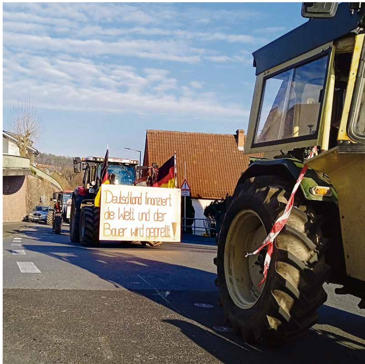
Am Startpunkt in Lützelbach-Seckmauern fuhren am Mittwoch 13 Traktoren mit Polizeibegleitung los zum Wiesenmarktgelände in Erbach.

Odenwaldkreis. Am Mittwoch, 10. Januar, haben sich Odenwälder Landwirte auf dem Wiesenmarktgelände in Erbach versammelt, um gegen die geplanten Kürzungen der Bundesregierung zu protestieren. Das Odenwälder Journal hat mit Mitorganisator Hans Trumpfheller vor der Demonstration gesprochen. Die Lage der Bauern im Odenwald ist nach Trumpfheller von den Subventionen und Steuererleichterungen stark beeinflusst, es herrsche teilweise Existenzangst. Als Mittelgebirgsregion sei der Odenwald keine „Gunsstlage“ für die Landwirtschaft, hier werden nicht die größten Erträge und Gewinne erzielt. Die Lebensmittel würden für die Verbraucher zu teuer. Einige Landwirte in der Region müssten den Betrieb einstellen, wenn die geplanten Kürzungen umgesetzt werden. Die Konsequenz daraus wäre ein Weniger an heimischen Lebensmitteln. Die geplanten Maßnahmen haben ein Volumen von etwa einer Milliarde Euro, so Trumpfheller.