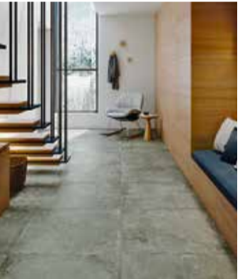
Keramischer Dielen- oder Parkettlook sorgt für unbeschwertes Wohnkomfort und eine deutliche Energieeffizienz auf der Fußbodenheizung als Echtholzböden.