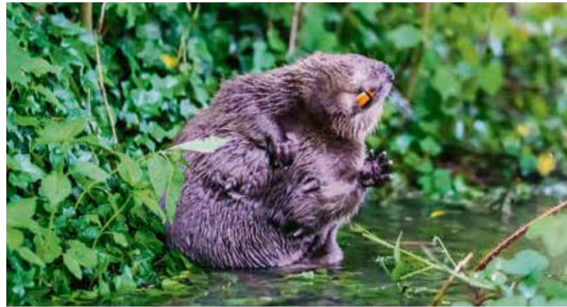
Kräftige Hauer für die Holzarbeit: eine Biber Mutter.

Die Artenvielfalt im Bereich der vom Biber aufgestauten, meist flachen Bachläufe, sei um das mehrere Hundertfache höher als vor dessen Bautätigkeit. Der Biber sei aber nicht nur in der Lage die Artenvielfalt zu fördern, sondern auch die Wasserrückhaltung in der Landschaft nachhaltig zu gewährleisten. Die Teiche der Biber puffern auch Hochwasserspitzen ab. Entscheidend für ein dauerhaftes