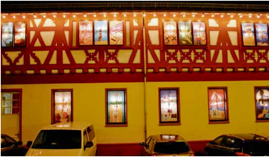
Weihnachtlich erstrahlen die Adventsfenster immer noch zur Abendzeit.