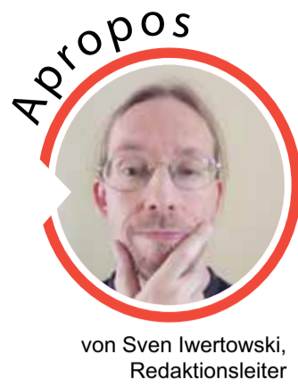
von Sven Iwertowski, Redaktionsleiter