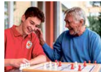
Durch regelmäßige Besuche helfen Ehrenamtliche älteren Menschen dabei, Demenz, sozialer Isolation und Bewegungsmangel entgegenzuwirken.

zusammengedreht, um Bedürftigen deutschlandweit zu helfen. Das Geld geht direkt an die lokalen Hilfsprojekte des DRK, zum Beispiel für die aktivierenden Hausbesuche in Süd-West-Deutschland. Die Kooperation zwischen STADA und dem DRK wird auch 2024 fortgesetzt. Jeder kann mit dem Kauf eines Medikaments aus dem OTC-Generika-Sortiment von STADA die Initiative unterstützen.