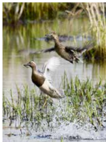
Die selten gewordenen Knäckenten siedeln sich auch in den Biberteichen im Odenwald an.

Die Polizei sucht Zeugen, die die Fahrt auf der B45 beobachtet haben. Hinweise an Tel.: 06062-9530. red