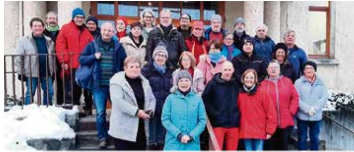
Deutsch-französische Freundschaft in Olfen Seite 8

Klein, aber fein: Leben in Stockheim Seite 6