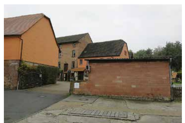
Die Stockheimer Mühle von außen. Auf dem Grundstück soll bereits im neunten Jahrhundert Korn gemahlen worden sein.

„Stocheim“ findet sich im Lorscher Codex von 1095. Auch eine Mühle wird dort erwähnt. Möglicherweise handelt es sich um die Stockheimer Mühle. Die Getreidemühle soll schon im achten oder neunten Jahrhundert Korn gemahlen haben und wäre dann eine der ältesten Mühlen im Odenwaldkreis. Die Gebäude, die heute dort stehen, sind jedoch höchstwahrscheinlich nicht vor dem Jahr 1800 erbaut worden. Dennoch steht die Stockheimer Mühle unter Denkmalschutz, genauso wie der unweit in der Mühlestraße plätschernde Dorfbrunnen. Die Verkehrslage von Stockheim ist eher günstig: Direkt am Verkehrsknotenpunkt B45/B47 gelegen, ist der Ort an die Netze von Bus und Bahn angeschlossen. Der alte Ortskern verfügt über die Feuerweh, einen Bolzplatz und eine 2021 renovierte Turnhalle – hier ist der Turnverein 1907 Stockheim aktiv. Auch das Hallenbad Odenwald und Einkaufsmöglichkeiten sind zu Fuß leicht zu erreichen.