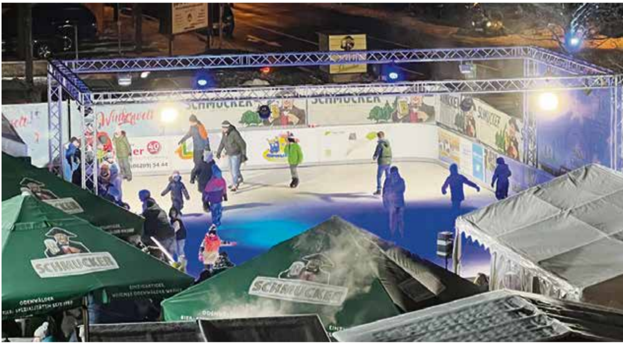
red Unbeschwerter Winterspaß verführte am Eröffnungswochenende viele dazu, die Schlittschuhe anzuziehen. Bis Mitte März wird hier geruscht.

Brensbach. Am Dienstag, 23. Januar, kontrollierte die Polizei von 12.15 bis 14 Uhr auf der B38 am Klärwerk in Brensbach die Geschwindigkeit der Fahrer. Vorgeschrieben ist dort die Höchstgeschwindigkeit 70 km/h. 200 Fahrzeuge wurden gemessen. Die meisten Verkehrsteilnehmer hielten sich an die Begrenzung, 13 Fahrer waren zu schnell unterwegs. Zwei Autofahrer teilten sich den „Spitzenplatz“: Sie waren 102 km/h zu schnell. Beide müssen jeweils ein Bußgeld von 150 Euro zahlen und erhalten einen Punkt in der Verkehrssünderkartei in Flensburg.