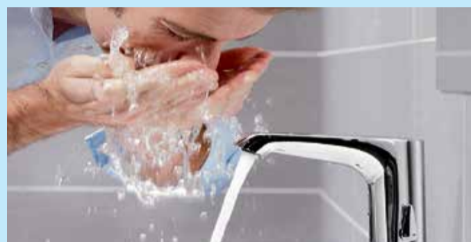
Spartipp unter dem Waschtisch: Eckventile mit Regulierfunktion lassen sich mit wenigen Handgriffen so einstellen, dass Wasser- und Energieverbrauch reduziert werden.

Eckventile können Energieverbrauch fast halbieren