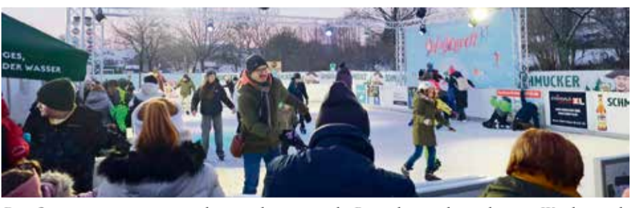
Die Organisatoren waren überrascht, wie viele Besucher sich am letzten Wochenende auf das Eis wagten.

3 Euro. Schlittschuhe gibt es leihweise vor Ort für 5 Euro (Erwachsene) und 4 Euro (Kinder). Die Eisstockbahn kann von Gruppen für 50 Euro gemietet werden. Schulklassen bis zur Jahrgangsstufe 7 aus den Landkreisen Bergstraße und Odenwaldkreis können die Eisbahn nach vorheriger Anmeldung von Mittwoch bis Freitag zwischen 10 und 12 Uhr. Sven Iwertowski