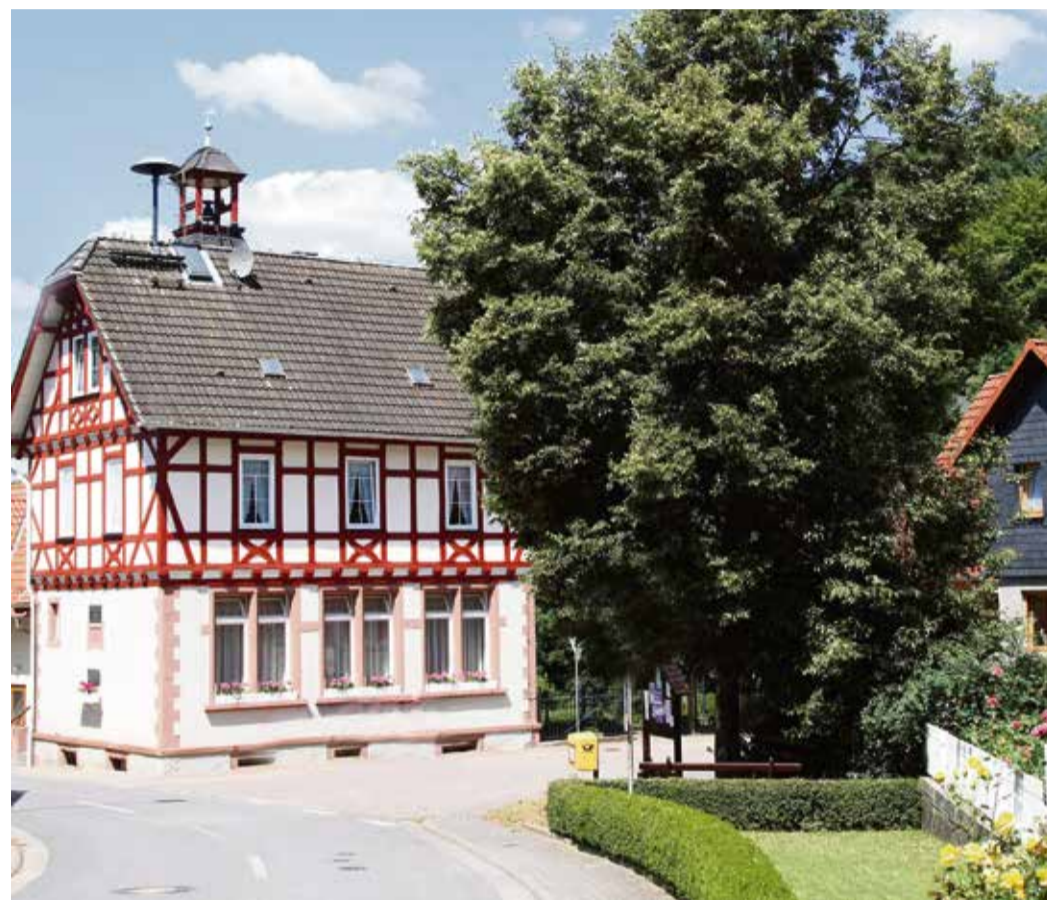
Die ehemalige Schule in Wallbach wurde von der Auswandererfamilie Gehring 1899 gestiftet.

des Rathauses. In einem Mix aus städtischer Villa und dörflichem Stil gebaut, wurde dieses Gebäude von der ausgewanderten Familie Gehring 1899 gestiftet. Neben diesem Gebäude stehen noch drei weitere Anwesen des Dorfes unter Denkmalschutz. red