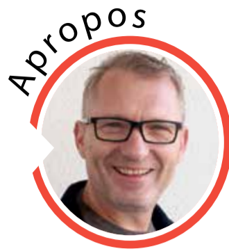
von Volker Zaborowski, Chefredakteur