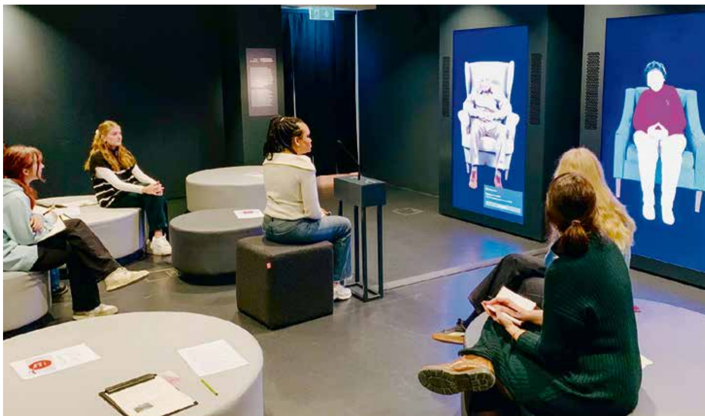
Schüler der GAZ während des interaktiven Zeitzeugengesprächs im Technikraum des Exilarchivs.

Exkursion des Geschichts-Leistungskurses mit KI-Interview