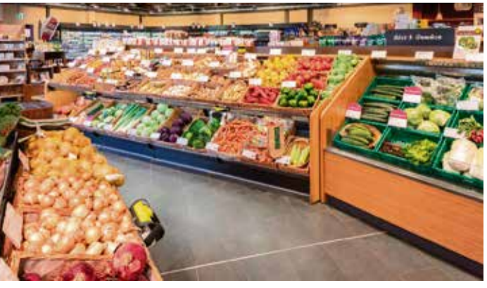
Täglich frisches Obst und Gemüse aus biologischem Anbau: Seit einem Jahr bietet Denns BioMarkt als Fachmarkt vor Ort in Erbach Bio-Vielfalt und Frische mit Verlass.