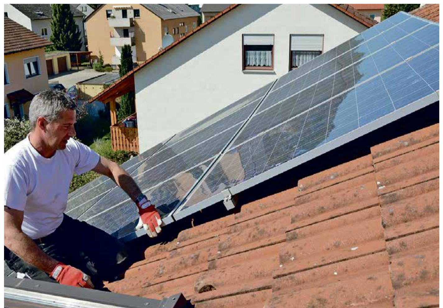
Der qualifizierte Dachdecker prüft die Befestigungen der Solarmodule und begutachtet die Unterkonstruktion im Rahmen des DachChecks.

arbeitet eine Solaranlage weiter. Nur bei großen Schneelasten oder sehr starken Verschmutzungen besteht Handlungsbedarf. Auch hier sollten Fachbetriebe zu Rate gezogen werden. Die fachgerechte Montage von Solaranlagen auf dem Dach ist entscheidend für Wirkungsgrad und Haltbarkeit, ebenso wie die regelmäßige Überprüfung der Anlage.