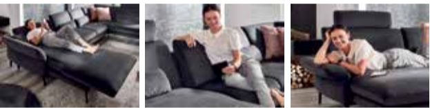
Motor-Ottomane Sitztiefeverstellung Armteilverstellung