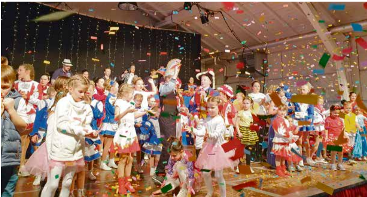
Die kleinsten Fastnächter konnten bereits ihre Kindersitzung des CV Ulk Erbach in den Markt- und Bierhallen ausgiebig feiern

Fastnacht treibt tausende „Narren“ in die Hallen und auf die Straßen