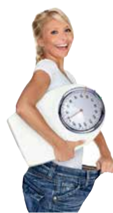
Glücklich dank Wohlfühfigur, mit der Nr. 1 Empfehlung aus der Apotheke.

formoline L112 gibt Ihnen die Freiheit beim Abnehmen auch Ihre Lieblingsgerichte zu genießen, strenger Verzicht ist nicht notwendig. Nehmen Sie einfach formoline L112 zu Ihren beiden Hauptmahlzeiten ein. Der Wirk-Ballaststoff L112 vermindert die Kalorienaufnahme aus den Nahrungsfetten. So erleben Sie Abnehmen mit Genuss und bleiben motiviert.