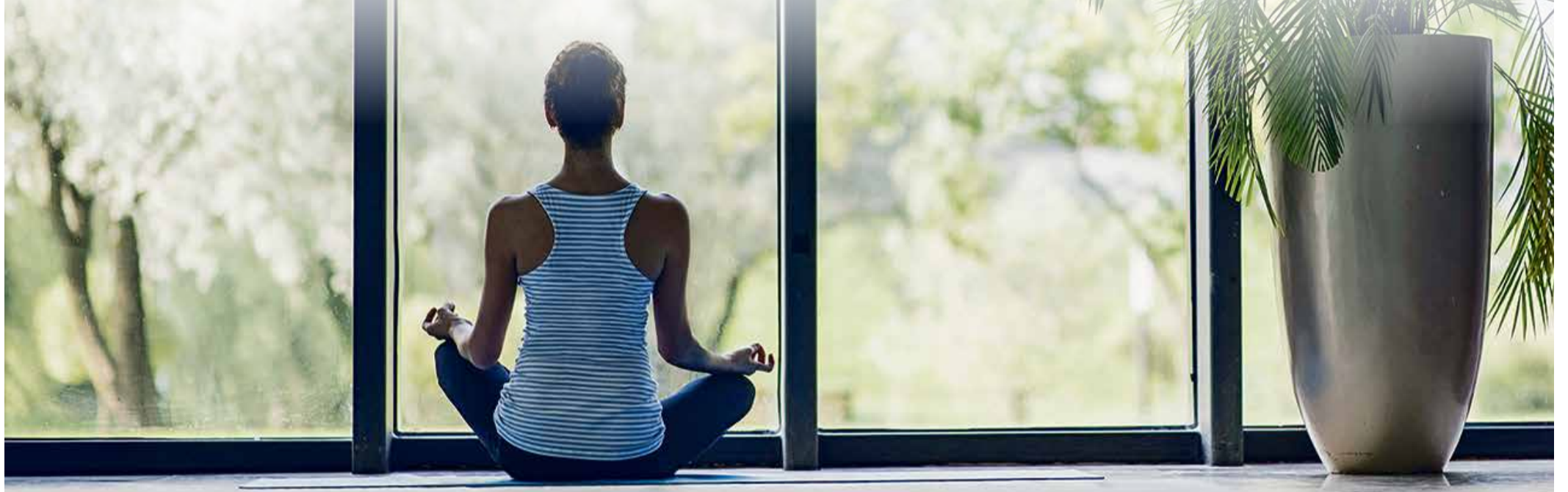
Sonnenschutzglas sorgt für von Tageslicht durchflutete Räume und senkt den Klimatisierungsbedarf – das spart bares Geld und freut gleichzeitig die Umwelt.

Hitzeschutz zum Abrunden einer Sanierung