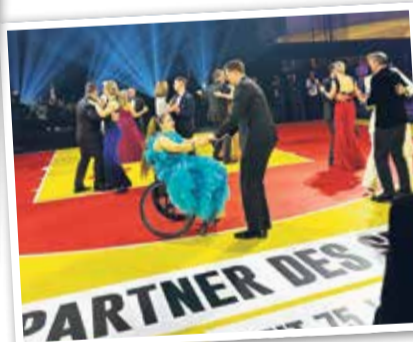
Viele Sportpromis beim Eröffnungstanz.