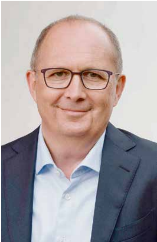
Dr. Peter Traub

Breuberg. Die Polizei kontrollierte am Donnerstag, 15. Februar, auf der B426 bei Rosenbach einen Kleinlaster mit osteuropäischer Zulassung. Laut Polizei verfügte der Lkw über ein Fünftonnenfahrgestell. Bei der Kontrolle zeigte der 35-jährige Fahrer zwei Zulassungsdokumente vor. Kennzeichen, Fahrgestellnummer und Dokumentennummer waren identisch, der Unterschied lag in der zulässigen Gesamtmasse und dem Leergewicht: Ein Dokument gab 3500 Kilogramm Gesamtmasse und ein Leergewicht von 2780 Kilogramm aus, das andere 7500 Kilogramm Gesamtmasse und 3740 Kilogramm Leergewicht, zudem die Fahrzeugklasse N1. Der Kleinlaster wurde leer gewogen. Mit teilgefülltem Tank, fehlendem Beifahrersitz und ohne Fahrer lag das Leergewicht bei 3480 Kilogramm. Ein Sachverständiger stellte fest, dass das Fahrzeug die Anforderungen der Fahrzeugklasse N1 nicht erfüllt. Die Fahrt endete vor Ort. Kennzeichen und Zulassungsbescheinigung wurden von der Polizei eingezogen und an das zuständige Konsulat gesandt. Der Fahrer wird sich wegen Urkundenfälschung verantworten müssen. Auch das Transportunternehmen bleibt nicht ungeschoren – für zwei ausstehende Transportaufträge werden „wertabschöpfende“ Maßnahmen vorgenommen. An Ort und Stelle wurden zudem 2200 Euro zur Sicherung des Verkehrs erhoben.