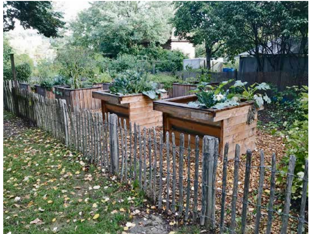
Die Hochbeete warten auf neue Pächter.