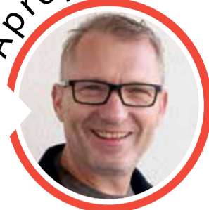
von Volker Zaborowski, Chefredakteur