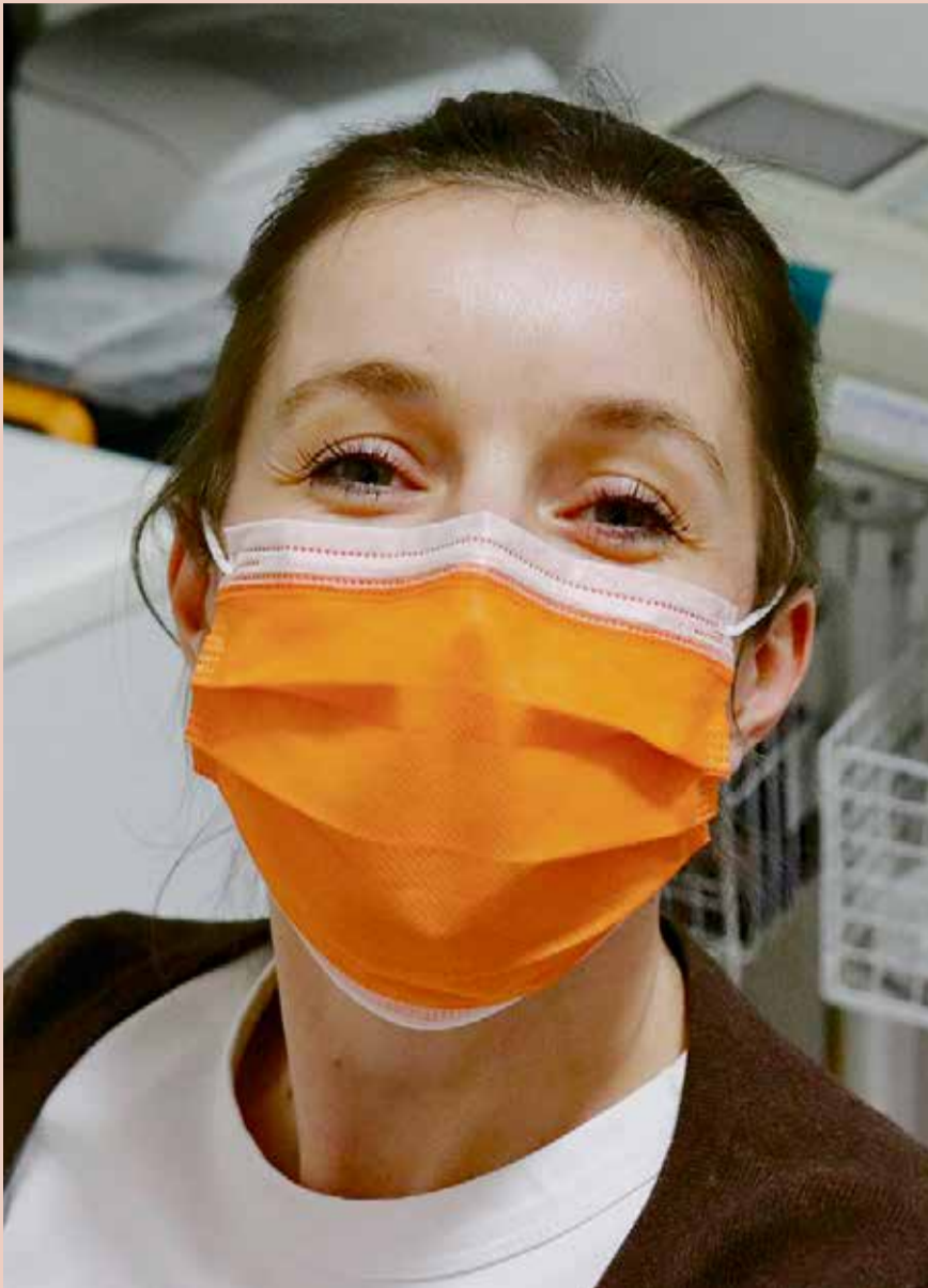
Der Pflegeberuf gilt als herausfordernd, aber auch als abwechslungsreich und interessant.