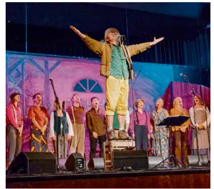
Hoch zur See mitten auf dem Trockenem - das verspricht der Shanty-Chor.