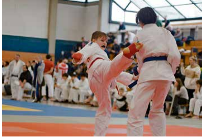
Vollen Einsatz brachten die Erbacher bei den Westdeutschen Meisterschaften.

Judo-Club Erbach bei Westdeutscher Meisterschaft