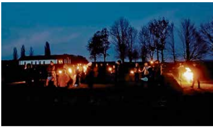
Stimmungsvoll erleuchtet soll der römische Ritus sein.

Auf Haselburg werden Terminalia gefeiert