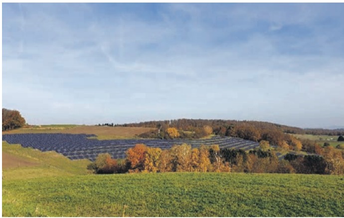
Der Bürgersolarpark Klein Bieberau (Gemeinde Modautal) ist ein gemeinsames Projekt der ENTEGA mit der Energiegenossenschaft Odenwald und soll Ende 2024 in Betrieb gehen.