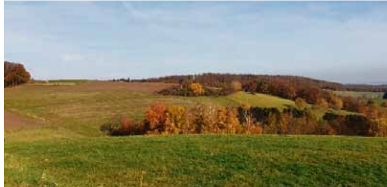
Der Bürgersolarpark Klein-Bieberau (Gemeinde Modautal) ist ein gemeinsames Projekt der ENTEGA mit der Energiegenossenschaft Starkenburg und soll Ende 2024 in Betrieb gehen.

Mit der Errichtung von ENTEGA-Solarparks auf Freiflächen in privater oder öffentlicher Hand möchte ENTEGA gemeinsam mit den Menschen vor Ort dafür sorgen, dass in der Region stetig mehr Ökostrom aus Sonnenenergie für alle Bürgerinnen und Bürger in der Region erzeugt wird. „Mit jedem neuen