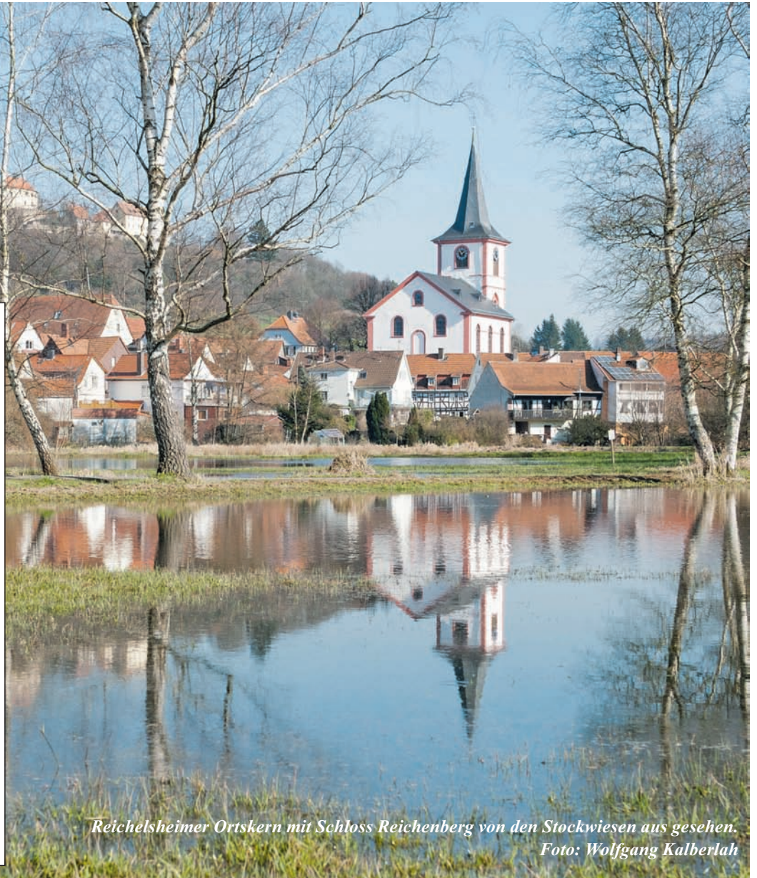
Reichelsheimer Ortskern mit Schloss Reichenberg von den Stockwiesen aus gesehen.

marco.clarizia@hdi.de https://berater.hdi.de/marco-clarizia/