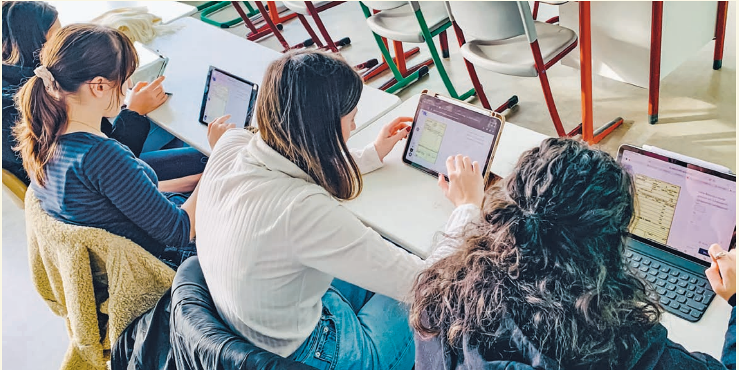
Ein Teil der Lernenden der GAZ während der Arbeit an der digitalen Datenbank.