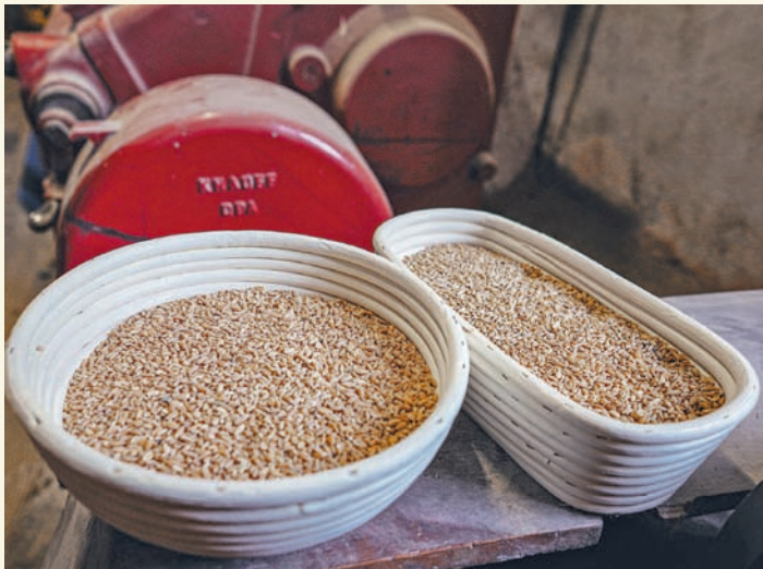
Soll noch bekannter werden in der Region: Nibelungenkorn, aufgenommen in der Herrnmühle in Reichelsheim. Dort können sich Bäckereien bei Interesse direkt melden.

Reichelsheim. Mehrere Bäckereien sowie Betriebe aus Landwirtschaft und Lebensmittelverarbeitung wollen das Angebot von Produkten aus Odenwälder Urgetreide forcieren. Dazu haben sich rund 25 Vertreter der Betriebe am Montagabend, 29. Januar, zu einem ersten Meinungsaustausch untereinander und mit mehreren Fachreferenten in der Reichelsheimer Stelle der Kreisverwaltung getroffen. Dazu eingeladen hatte die Ökomodell-Region Süd.