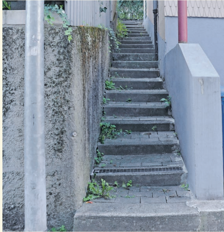
„Pädchen früher und heute“ – wie hier der Rest des einstigen Pestpfädchens – bilden das Thema des neuesten Babbelnachmittags im Reichelsheimer Museum.

Aus heutiger Sicht sind „Pädchen“, wie sie im Dialekt bezeichnet werden, alle fußläufigen Verbindungen, die weder mit Autos noch mit größeren landwirtschaftlichen Maschinen befahren werden. Reichelsheim bietet zahlreiche solcher schmalen Wege und wer schnell durch die Gemeinde kommen möchte, sich obendrein noch ein wenig auskennt, nutzt sie, bewegt