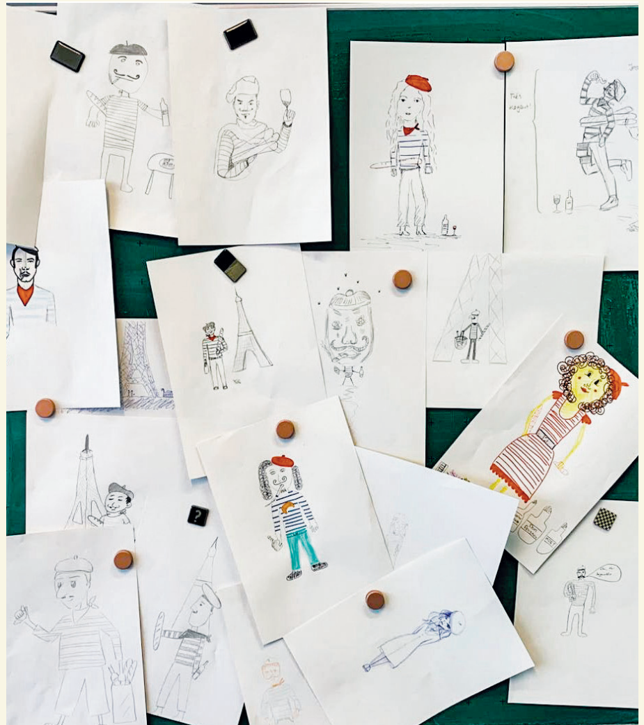
Kreativ werden durften die Schüler am Fachtag auch.